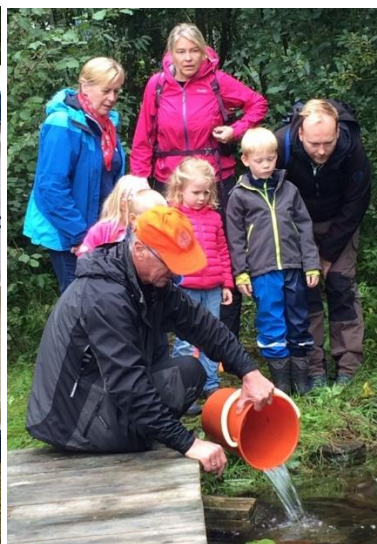
Spennende med både skyting og utsetting av ørret

Askerelven og Neselven. Fylkesmannen i Oslo og Akershus (FOA) har nå åpnet for organisert fiske i disse elvene etter anadrome fiskearter (Laks og Sjøørret). Det er nå innført fiskekort og rapporteringsplikt for fangst. Fangstrapport må også sendt til FOA. Fiskekort og kart over elvene blir solgt hos Jakt og Friluft på Hvalstad. Årskortet koster 300 kroner. 100 kroner blir returnert ved innlevering av fangstrapport. Fiske pågår i hht følgende tider: