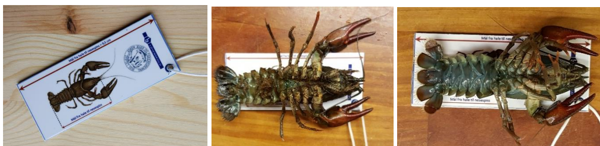
Nytt av året. Målepinne for kreps- Stor nok kreps (over 9,5 cm)- For liten kreps (9 cm) slippes ut igjen

Det har vært økt oppsyn i år med totalt 17 oppsynsdøgn.