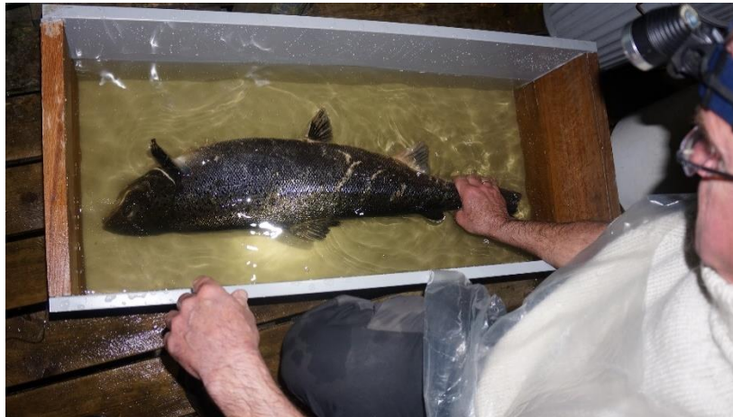
Hunlaks på ca 6 kg, fra Askerelven, klar til steking.

bakgrunn av en skjellprøve. Heldigvis var denne fisken ikke mulig å stryke og ble derfor kastet. All annen rogn som er lagt inn er gentestet hos Veterinærinstituttet og funnet bekreftet å være villfisk.