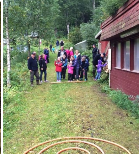
Jakt og fiske ble presentert under årets Semiade