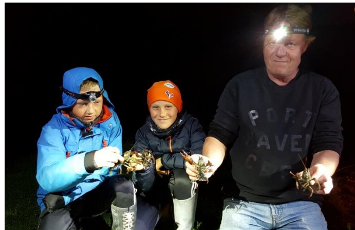
Krepsing, Spenning for barn og voksne.

Semiaden ble gjennomført 13. september for 9nde gang og arrangeres av Rotaryklubbene i Asker, Røyken, Hurum og NaKuHel-senteret i Asker med deltagelse av 23 lag og organisasjoner fordelt rundt Semsvannet. AJFF og settefiskanlegget er post nr 4 på runden. Det var stor interesse for fiskeanlegget og vi hadde flere hundre besøkende. Nytt i år var at Asker JFF ble representert noe bredere enn tidligere. I år deltok også jaktutvalge for å vise aktiviteter de bedriver med.