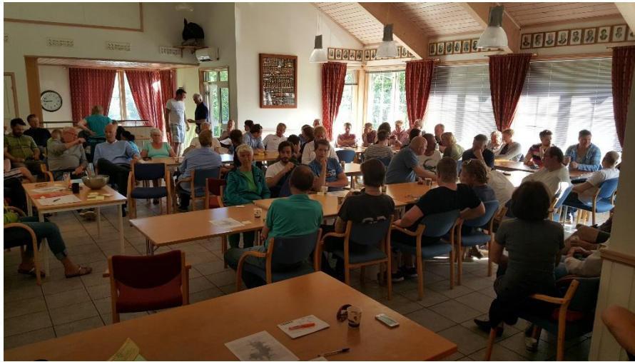
Trekning av krepsekort på klubbhuset.

tonn. Forekomsten av kreps har blitt redusert med mer enn 75 prosent. AJFF har derfor et stort ansvar for å ta godt vare på denne sårbare arten.