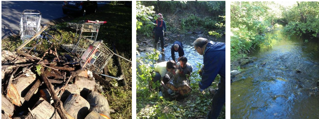
Opprydding i Neselven bidrar til økt trivsel langs Neselven.

Dugnad i Neselven gjennomføres hvert år i regi av Civitan Asker. AJFF deltar hvert år som fiskeforvalter av elven. Dugnaden foregår først og fremst fra broen ved Nesåsen og ned mot sjøen. Det er først og fremst opprydding av søppel, kvist og trerydding. Som takk for hjelpen støtter Asker kommune dugnaden med et lite pengebeløp.