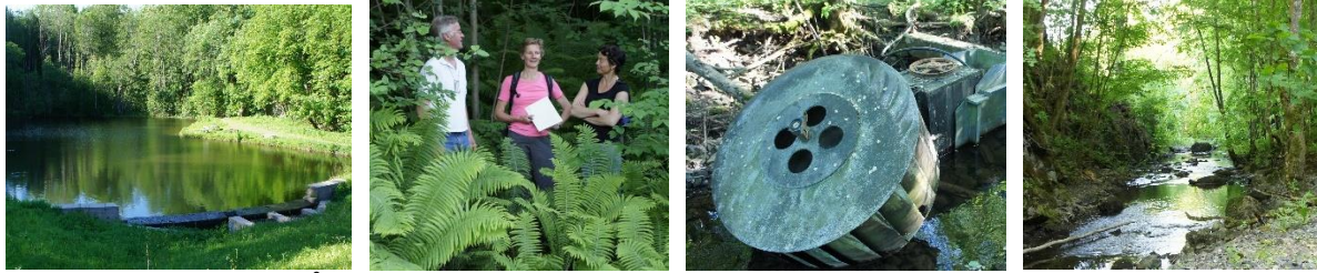
Befaring i Neselven. Åstad dammen, diskusjon om elvens befatning, gammelt kraftverk, idyll langs elven.

Krepsekortsalget 17 juni slo alle rekorder. Mer enn 50 mennesker kom på trekningen og flere soner ble raskt utsolgt. Det er stor rift om de beste sonene de første dagene. Dette er en fin anledning for familier for å komme seg ut i marka og oppleve et av nattens kanskje mest uvanlige fangstmetoder. Det vurderes økt oppsyn og kontroll av fangstene. Edelkrepsen er en sårbar art og finnes både på den norske og internasjonale rødlista over trua arter. Edelkrepsen er mest truet ute i Europa, men også i Norge har krepsebestanden gått kraftig tilbake de siste tiårene. På 1960-tallet var fangsten på mer enn 40 tonn årlig, mens det i dag fanges ca. 10-12 tonn. Forekomsten av krepse har blitt redusert med mer enn 75 prosent. AJFF har derfor et stort ansvar for å ta godt vare på denne sårbare arten.