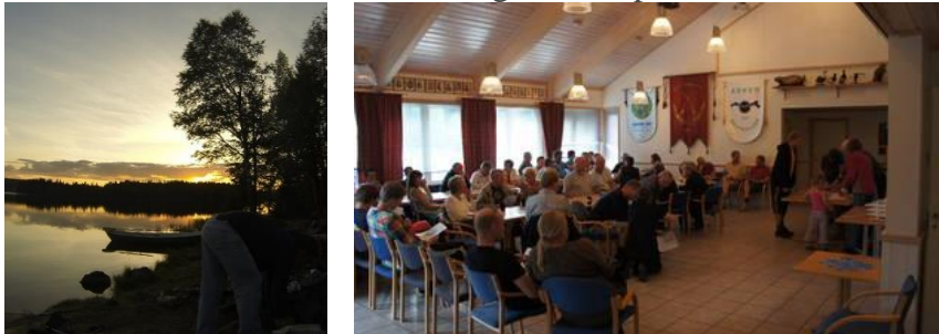
Stemmingsbilder fra Sandungen og trekning av krepsekort på klubbhuset.

Krepsekortsalget 17 juni slo alle rekorder. Mer enn 50 mennesker kom på trekningen og flere soner ble raskt utsolgt. Det er stor rift om de beste sonene de første dagene. Dette er en fin anledning for familier for å komme seg ut i marka og oppleve et av nattens kanskje mest uvanlige fangstmetoder. Det vurderes økt oppsyn og kontroll av fangstene. Edelkrepsen er en sårbar art og finnes både på den norske og internasjonale rødlista over trua arter. Edelkrepsen er mest truet ute i Europa, men også i Norge har krepsebestanden gått kraftig tilbake de siste tiårene. På 1960-tallet var fangsten på mer enn 40 tonn årlig, mens det i dag fanges ca. 10-12 tonn. Forekomsten av krepse har blitt redusert med mer enn 75 prosent. AJFF har derfor et stort ansvar for å ta godt vare på denne sårbare arten.