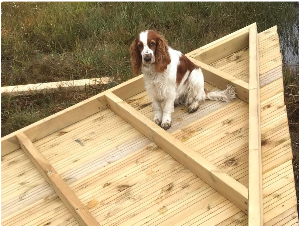
Otivia holder kontroll på kortveggene.