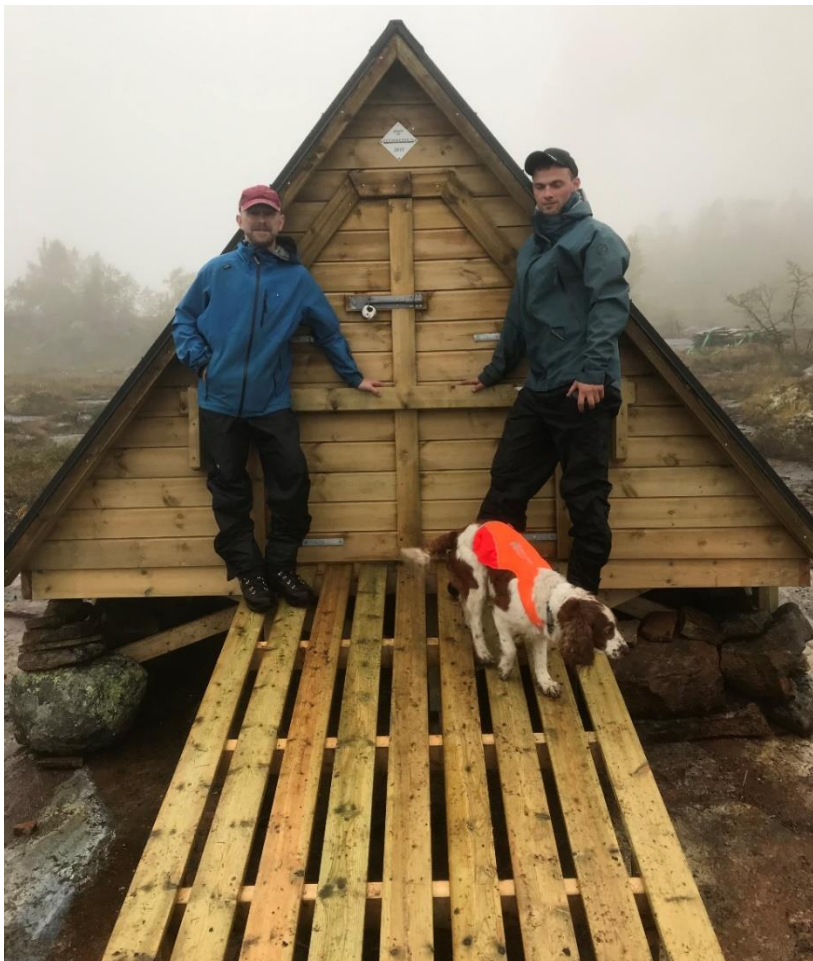
Ferdig for denne gang