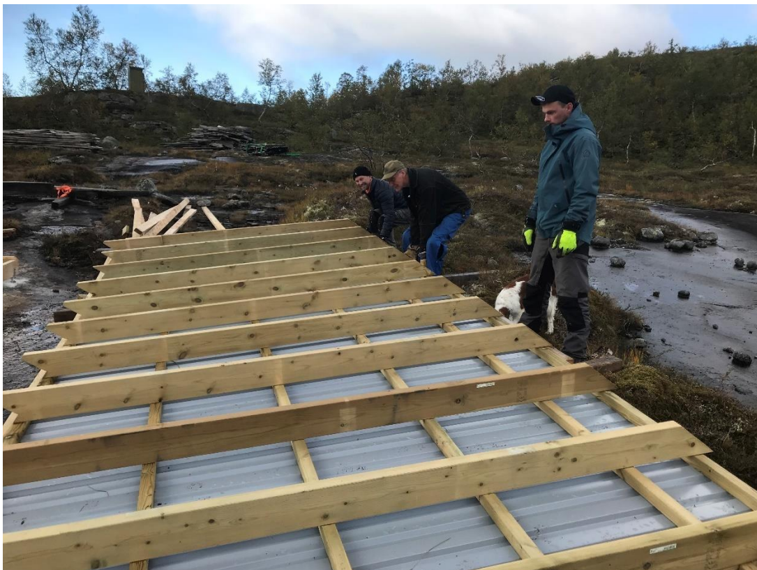
Sterke karer klart for neste tak-element