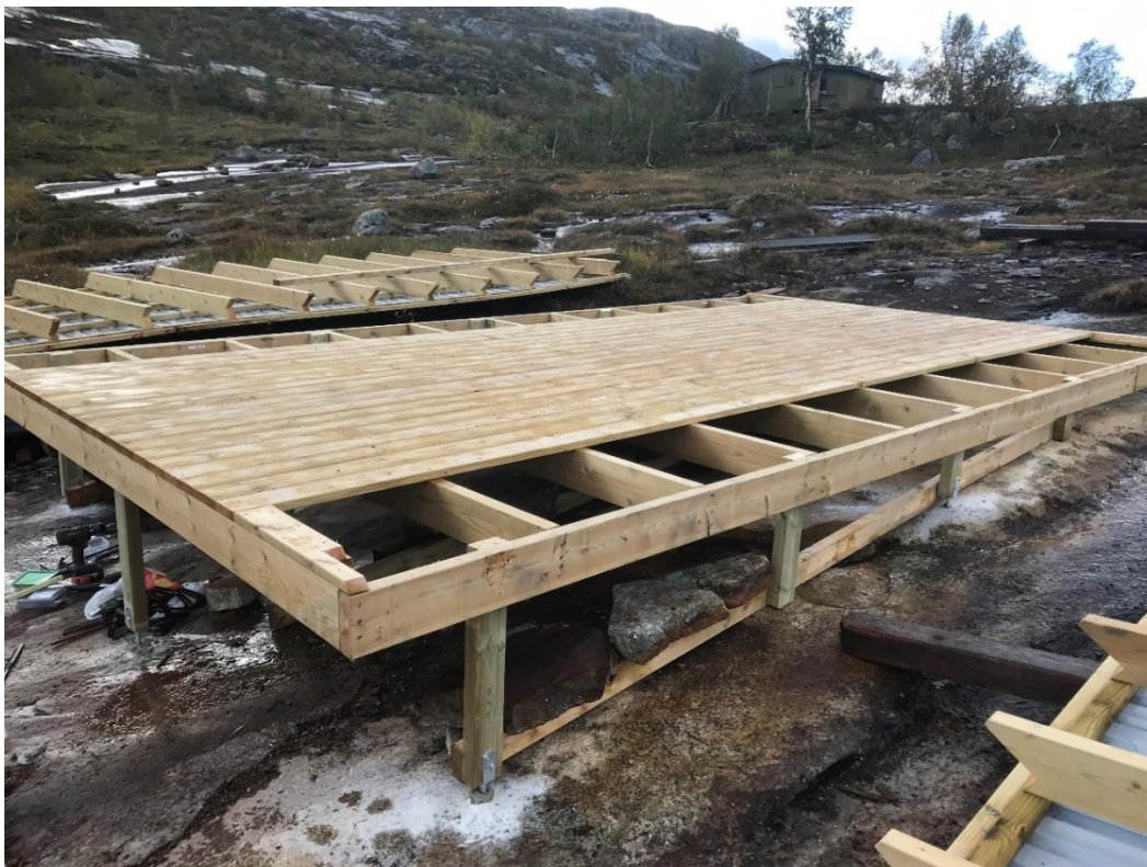
Festet på søylesko/ankermasse/stein