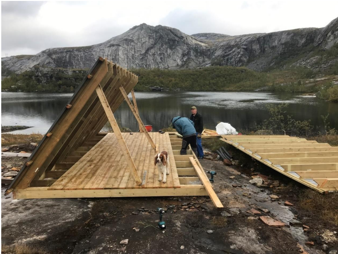
Første tak-element på plass