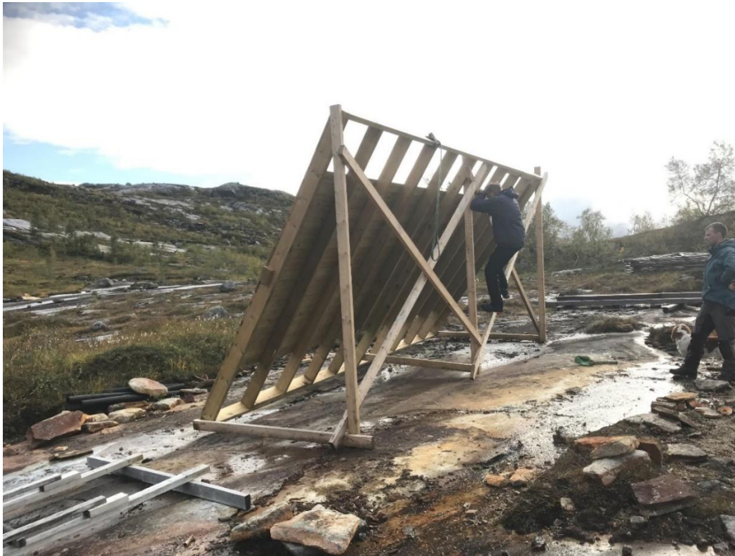
Gulv/fundament plassert av helikopter