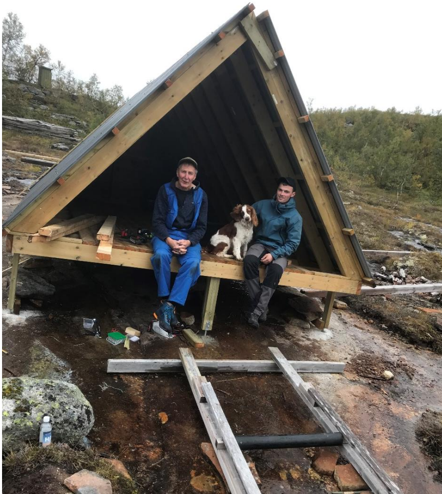
Taket kommet på