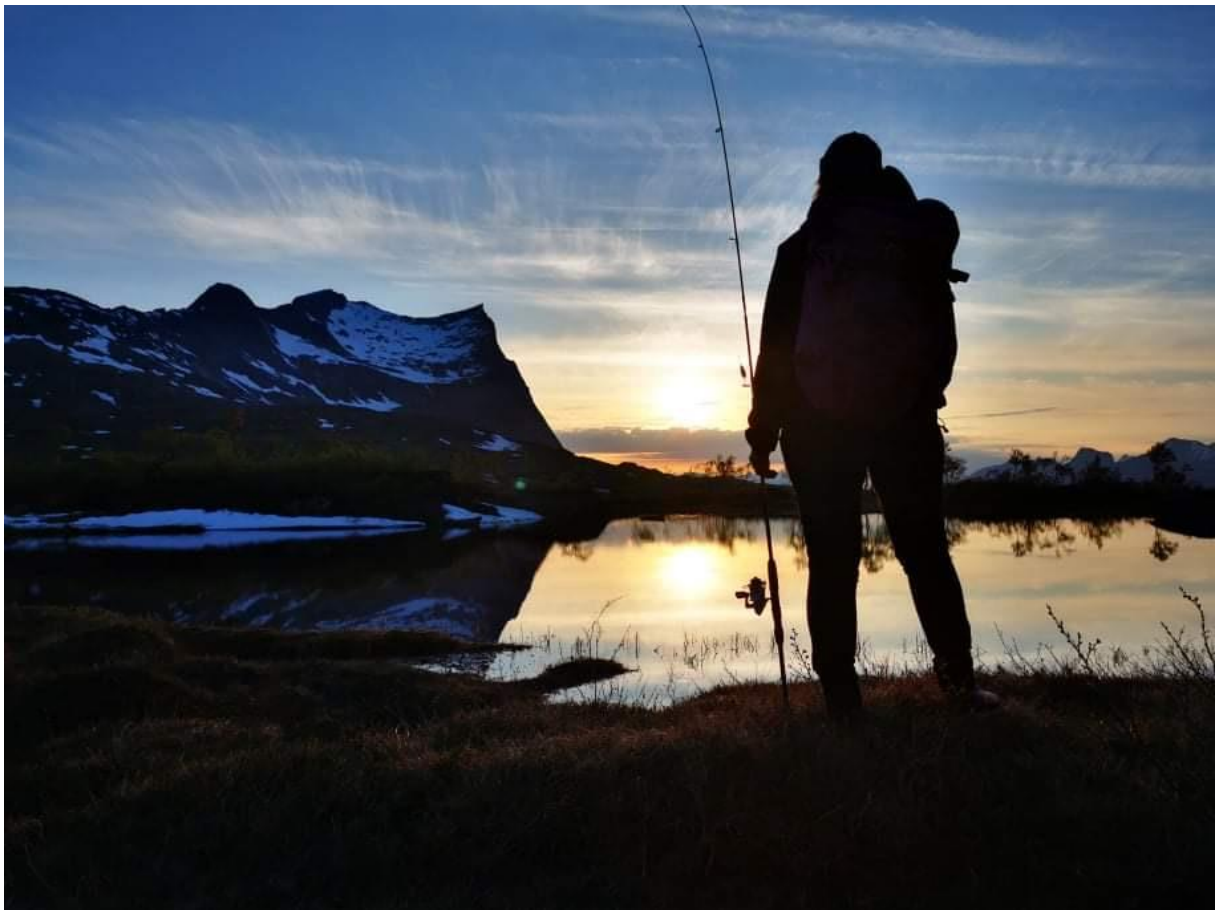
Midnattsol ved Korviktinden.

Foreningen har pr. 31.12.2021 en oppslutning på 515 Aktive medlemmer. Av disse er 75 Barne-/ungdomsmedlemmer.