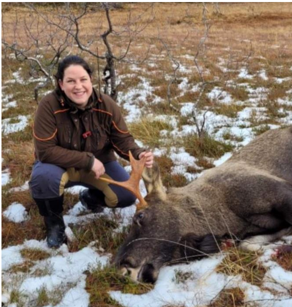
Stolt førstegangsjeger i Sjunkhatten nasjonalpark.

Viser til NJFF-Nordlands e-post: nordland@njff.no , mob. 941 72 727 eller kalender på nettsidene: http://www.njff.no/nordland