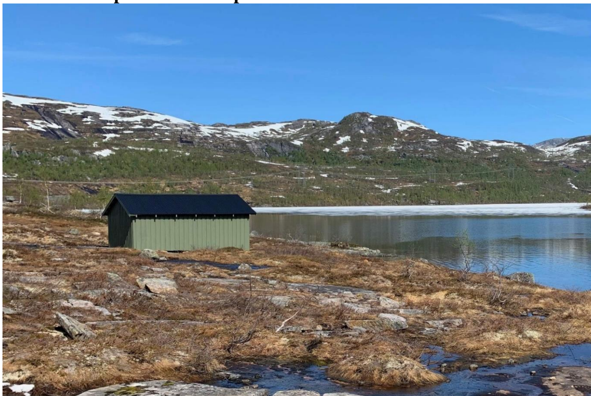
Slik så det gamle naustet ut ved Steinsvatn