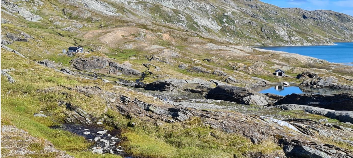
Hytte og naust sett mot øst.