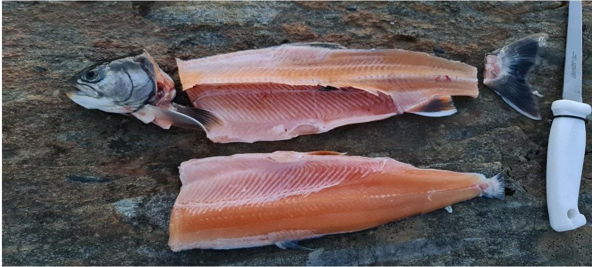
Prima vare fra Veiski!