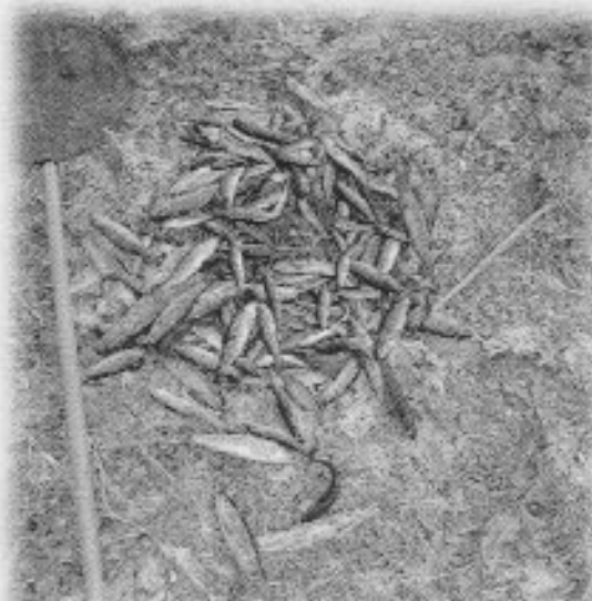
El fiske, har gitt bra resultater i år.