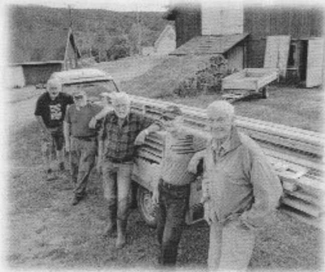
Et nytt tilhengerlass med lemmer er klare for å bli lagt ut rundt vanna.