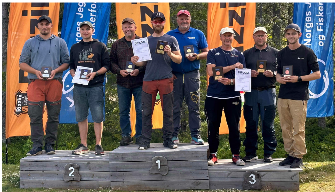
Bronse lagskyting NM leirduesti