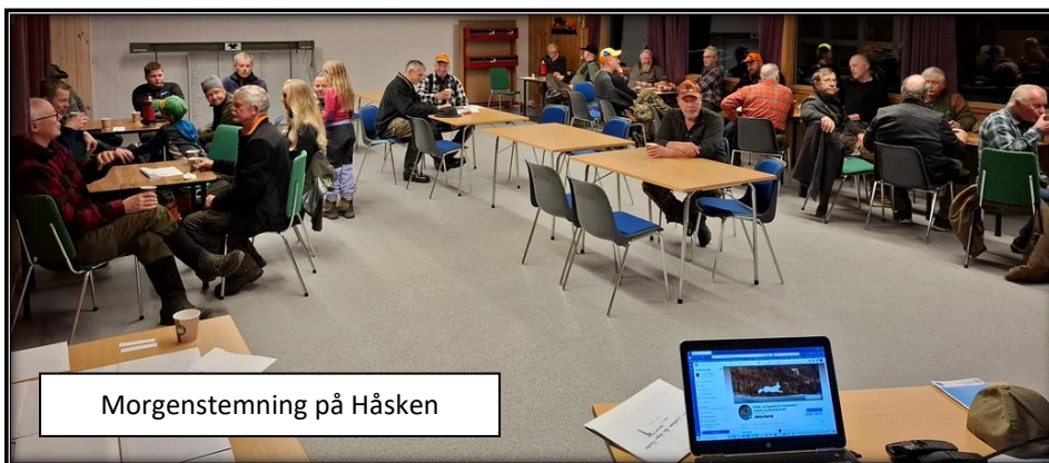
Morgenstemning på Håskén