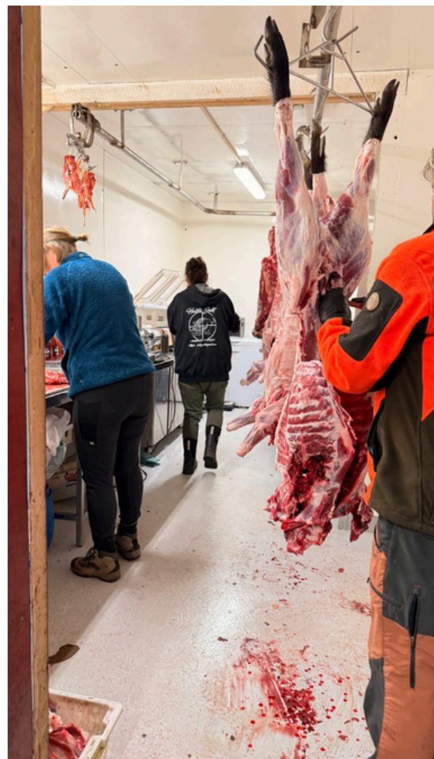
Alt som kan brukes til mat på dyret blir delt opp i passende biter, vakumpakket og forseglet.