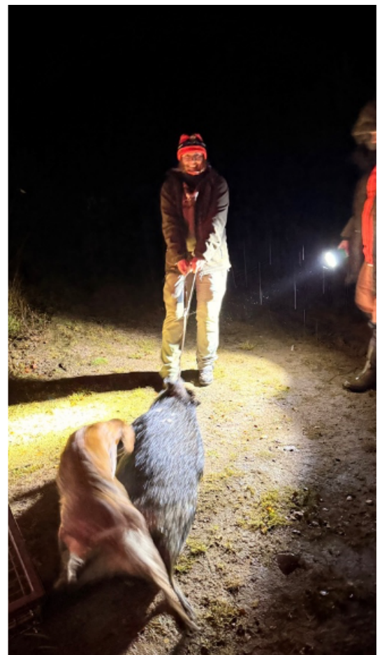
Hund ble med på ettersøk, men grisen lå heldigvis nære og var helt død.

Hun har ikke sittet nevneverdig stille, så forventer ikke å se noen fler dyr ved fôr-tønnene, men da hun plukker opp kikkerten står der brått flere gris og spiser. Hadde ikke hennes gris løpt av gårde kunne hun skutt fler, men nå kan hun kun se på de da hun må vente på ettersøkshund.