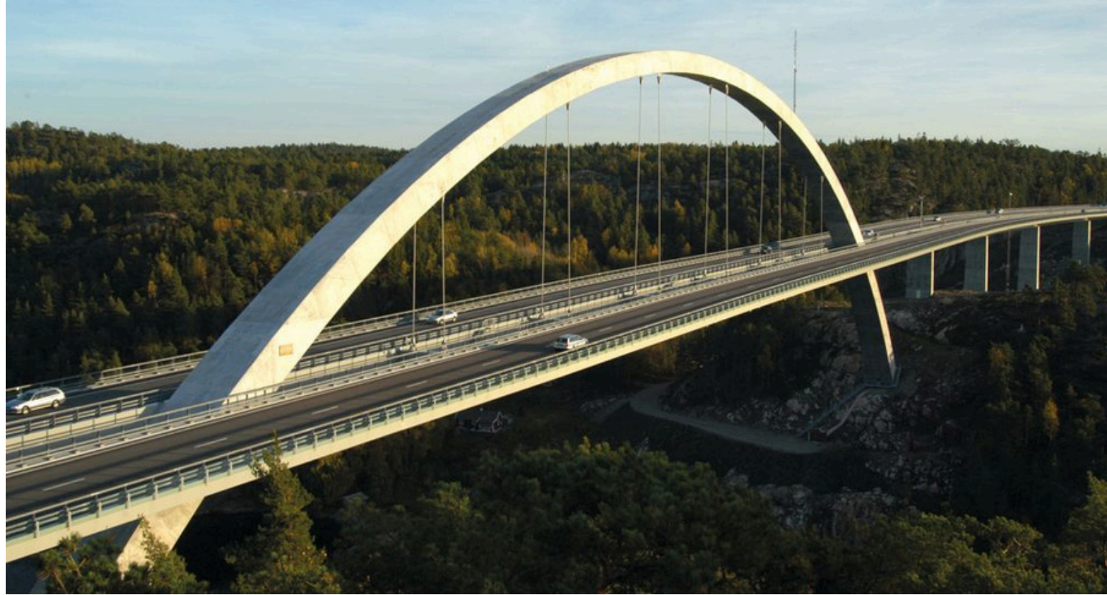
Over Svinesund etter svin. Målet er ikke Nordby-senteret, men villsvin i de smålandske skogene.