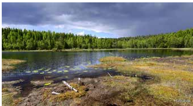
Abbotjern nord og sør for Storflåtan (nord vest utenfor kartet) Abbor og ørret.

Loka/Rundtjern Skogstjern med tilknytning til Vesleflåtan. Sik, abbor og ørret. Spennende myrtjern hvor