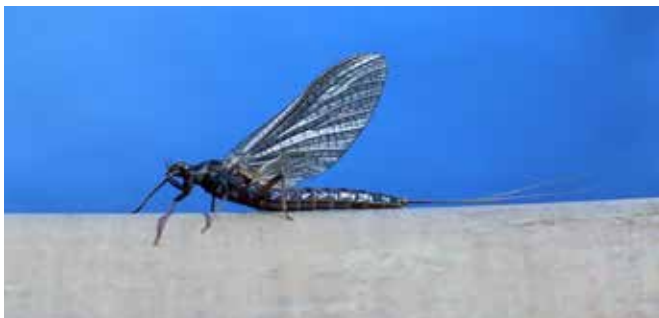
Vespertina dun .

Langs mange vann og tjern blåses maur med vinden ut på vannet fra tuer på øyer og fastland og blir til lokkende proteinbomber for ørreten. I tillegg klekkes det fortsatt mygg, og døgnflue klekninger kan være i en mellomperiode. Myrdøgnflua Vespertina har gitt seg for i år siden den viser seg kun de 3 første ukene etter at isen har gått, og lillebror og Marginata , er gjerne i sin siste livs fase i slutten av mai og begynnelsen av juni. Vespertina imiteres best på krok 12/14 og Marginata bør du ha i krok 16 og noen ganger helt ned i krok 18. Kroppsfargevalget kan gjerne være det samme på begge fluene. Fluene finnes som nymfe, klekker, dun og spent spinner.