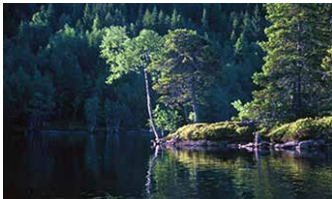
Bilde fra Søndre Heggelivann som kan fiskes fra land, eller fra kano, bellybåt eller packraft.

Bruk gjerne krokstørrelse 9 eller 10 ved selvbinding eller ved kjøp av ferdig bundet variant. Glem heller ikke det siste stadiet for insektet – spent spinner. Da ligger det døde insekter på vannet og store ørreter og abbor rydder vannet rolig og systematisk utover kvelden.