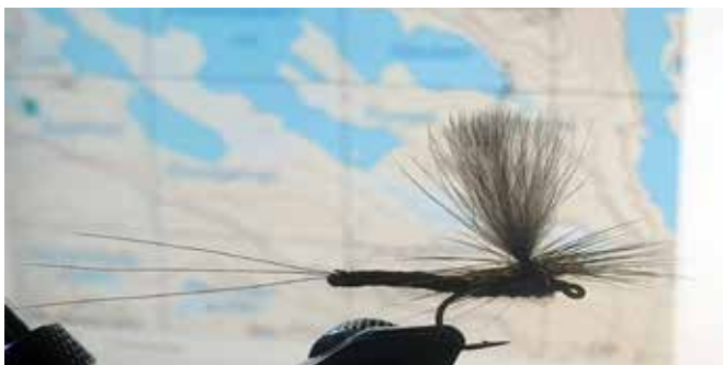
Ephemera Vulgata.