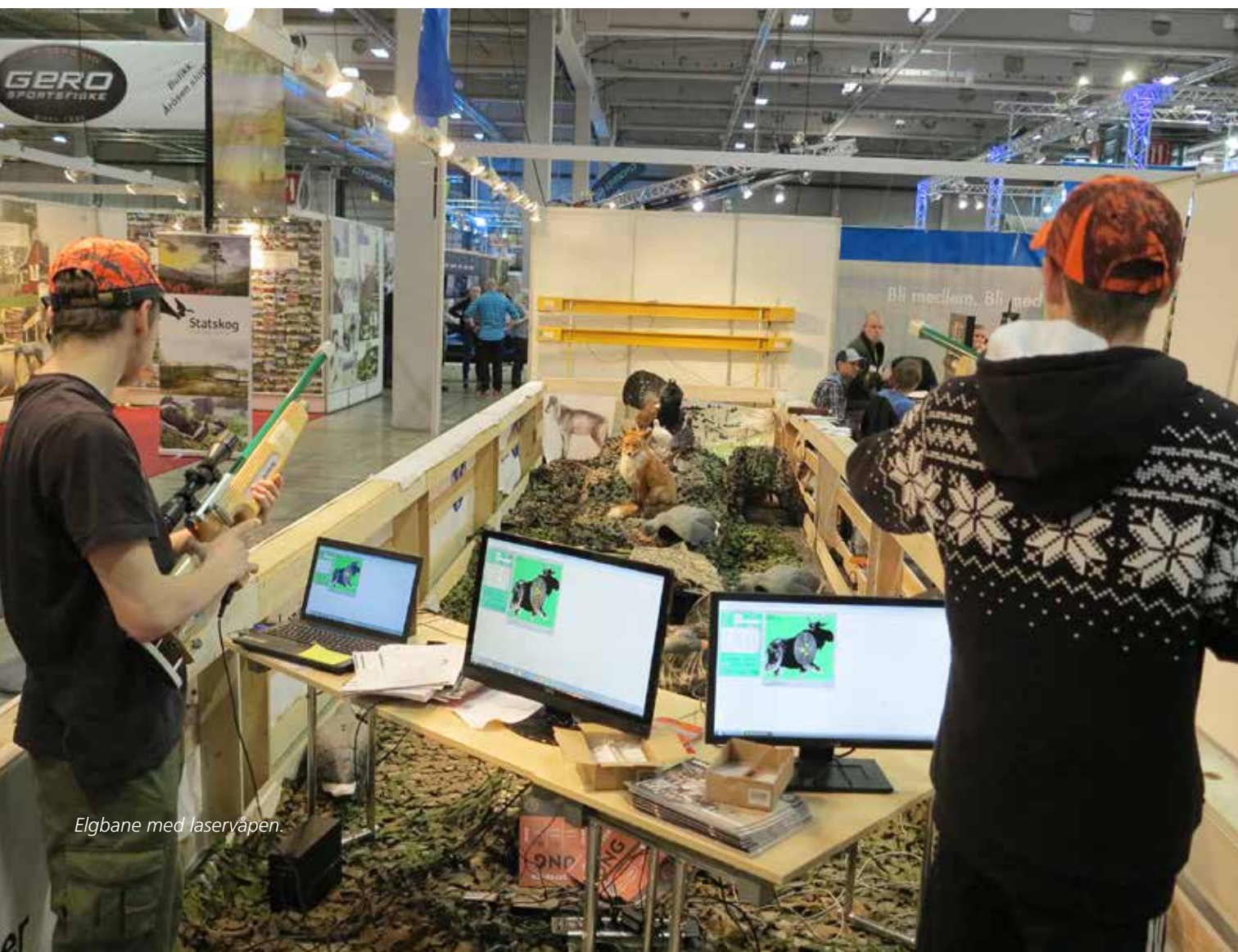
Elgbane med laservåpen.