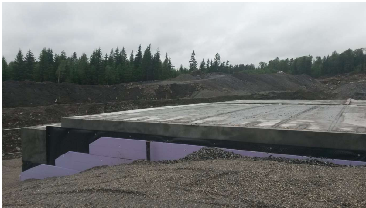
Tilbakeblikk: Grunnmuren til klubbhuset i juni i år. I skrivende stund er huset satt opp på muren og det gjenstår ferdigstilling hovedsakelig