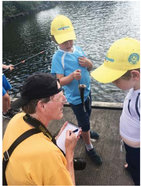
REDIGER Ås avis