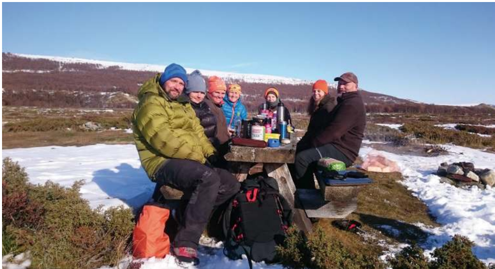
Flere fra kvinnegruppa har i høst deltatt aktivt på flere arrangementer, her på rypejakt i Grimsdalen i regi av Dovre JFF, NJFF-Oppland og Dovre Fjellstyre.