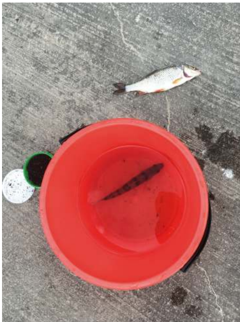
REDIGER Tekst om fisk