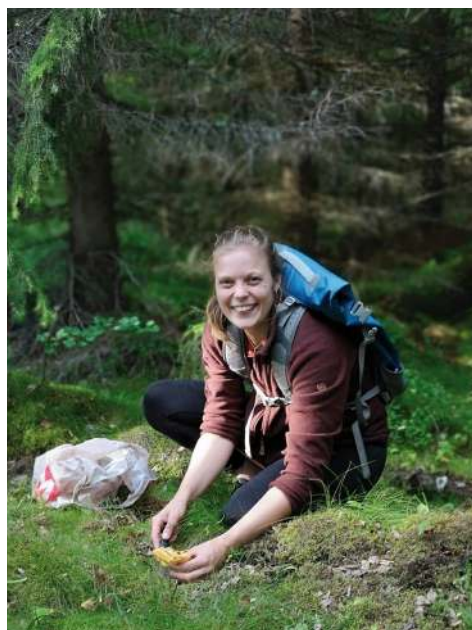
Kvinnekontakt Line har funnet gull på sopptur.

Neste år fortsetter vi med kvinneskyting på haglebanen torsdager. Kvinnekontakt og sekretær er påmeldt hagleinstruktørkurs i Flå i mars for å øke kunnskapsnivået rundt