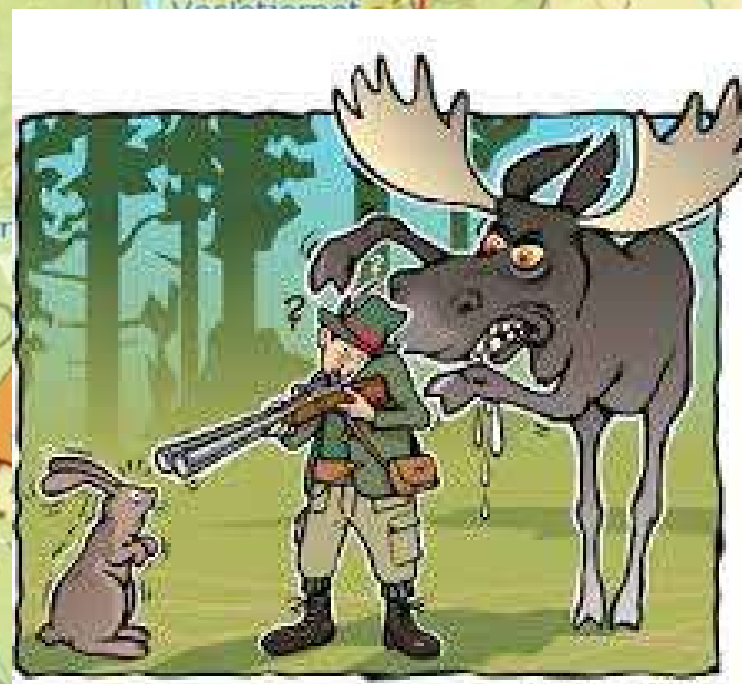
Illustrasjon fra Grunneierlaget 2008 Tidsskrift / Erlingman