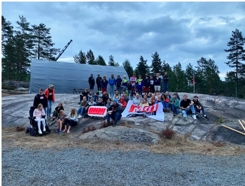
Storsamling på Solem av ungdommer ved skolestart.

Les mer om MOT her: MOT i ungdomsskolen - Gjerstad kommune