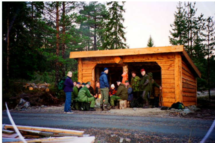
Flere lag har bygda sin egen gapahuk. Her Vestøl jaktlag.

* Først på 1900 tallet var det igjen så lite elg i Aust Agder at han ble totalfredet fra 1921 fram til 1941 hvor det i Gjerstad ble gitt en fellingskvote på 10 dyr. Under krigen var det naturligvis heller ikke organisert elgjakt, men i de siste krigsåra ble det nok skutt endel elg til matauk.