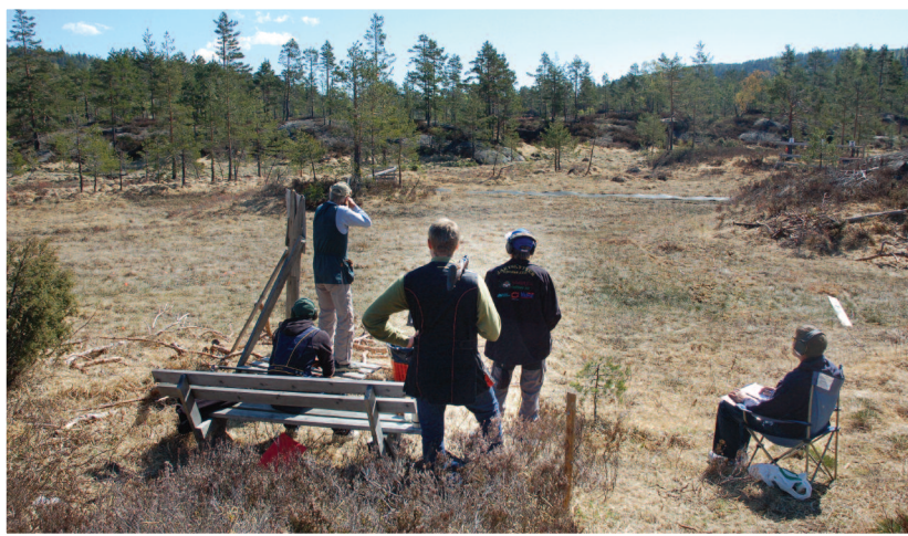
Hagleskyting, både jegertrap og leirduesti har blitt populært på Solem skytebane.