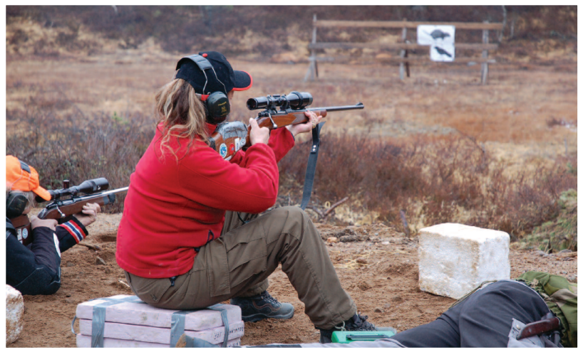
Jaktfelttskyting er en populær gren på Solem skytebane – også blant damene.

Gjerstad jeger- og fiskerforening ( GjJFF ) ble stiftet i 1965 for å sikre at retten til jakt, fiske og friluftsliv i Gjerstadskogene skulle komme kommunens innbyggere til gode. Medlemskap i foreningen er i dag tilgjengelig for alle og medlemstallet er ca 270. Helt siden starten har foreningens arbeid vært rettet mot en praktisk tilnærming til bruk og skjøtsel av de naturressursene vi har i vårt nærrområde, samt opplæring av ungdom i vilt- og fiskestell. I tillegg har våpenopplæring til jakt og konkurranseskyting alltid stått høyt i Gjerstad JFF.