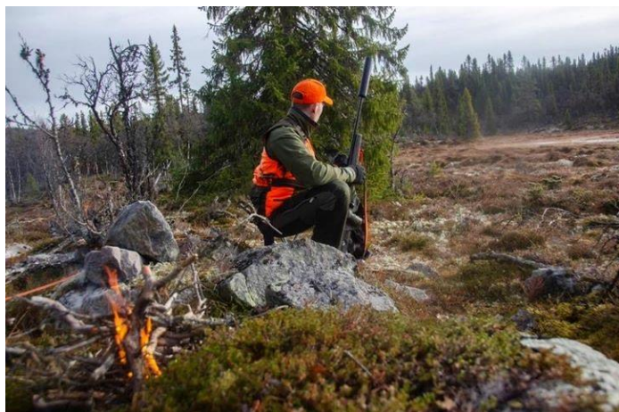
Tålmodighet er en dyd, også på introjakt elg

Frist for å fremme forslag til årsmøtet er 18. februar kl. 18:00.