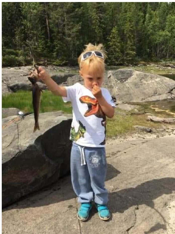
Morsomt å fiske, men det var den lukta, da...