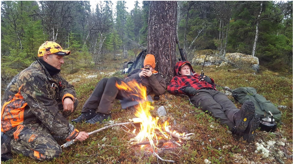
Bålkos på elgpost

Neste sesong ser vi frem til større interesse ved arrangementer og dugnader!!