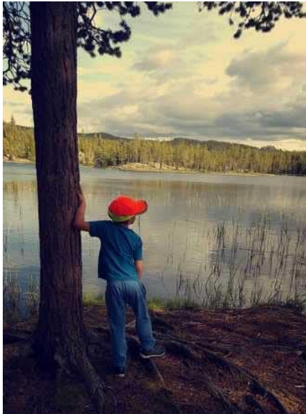
Fint ved Runda I Dalføret