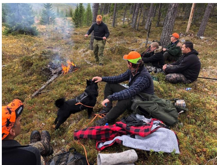
Mange oransje capser i skogen under Introjakt elg