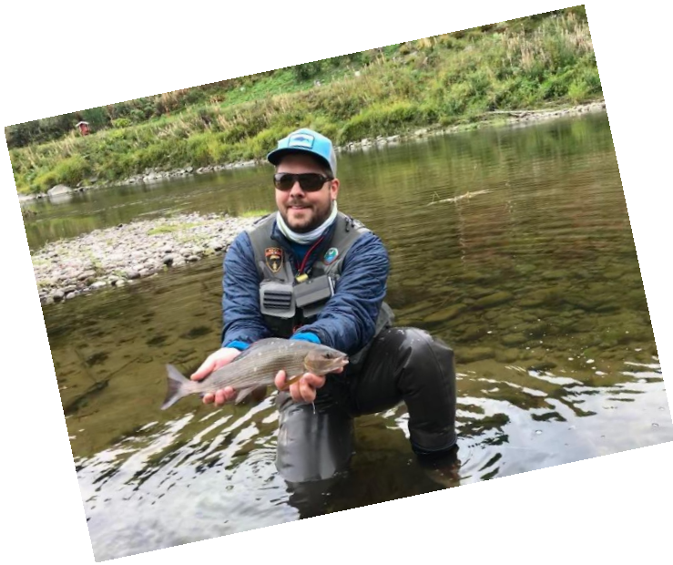
Fluefiskeklubben Whisky og Vak på harrfiske