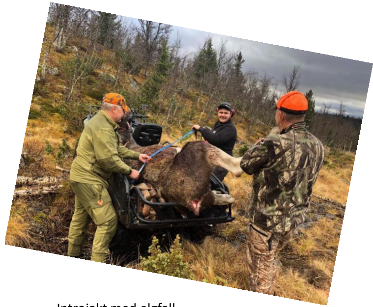
Introjakt med elgfall