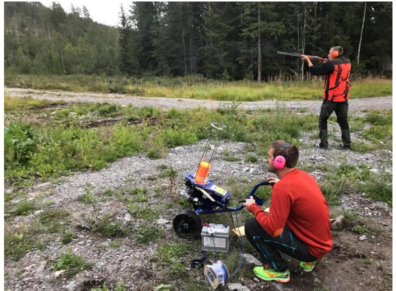
Ny leirduekaster i aksjon