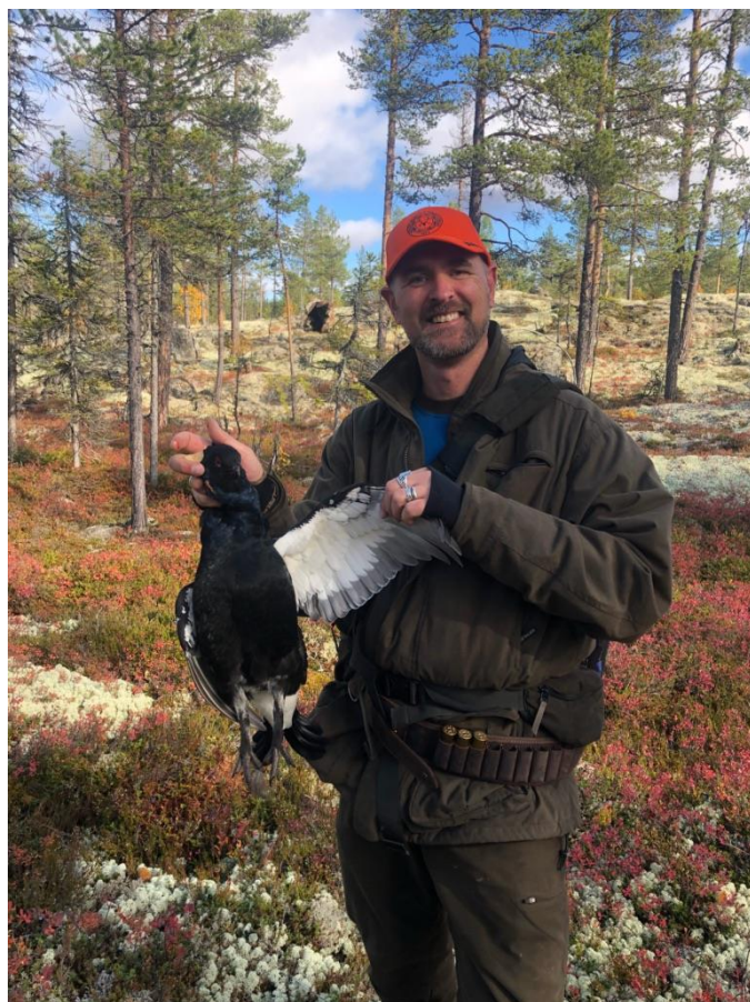
Bra med fugl i Dalføret. Fersk jeger med fersk fangst