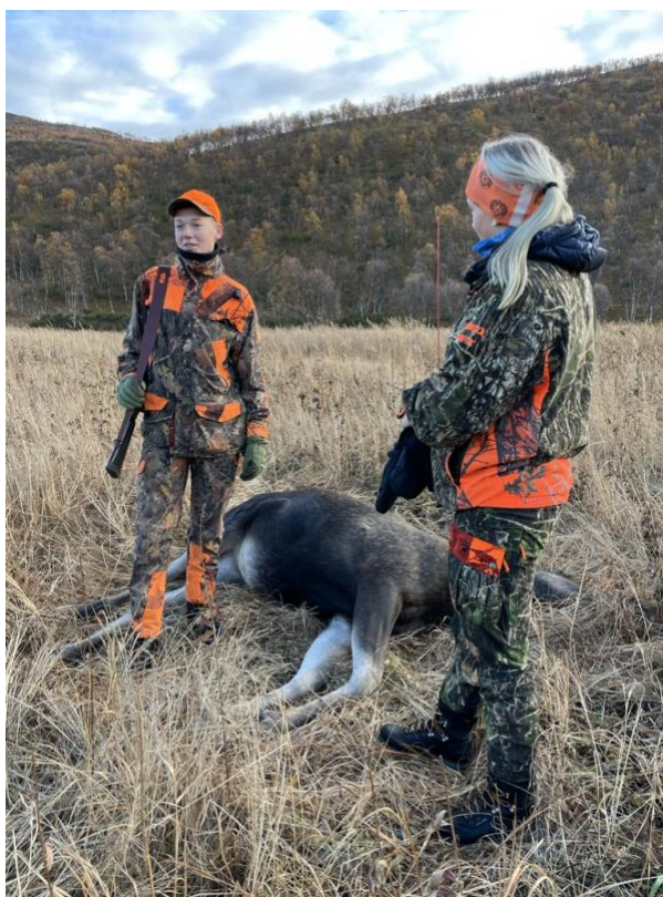
Elgjakt for ungdom Tana

Revisjonsrapport leveres ut på årsmøtet.