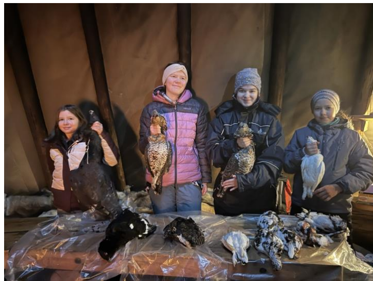
Villmarksleir på Neiden Fjellstue med fokus på tilberedning av fugl og fisk.