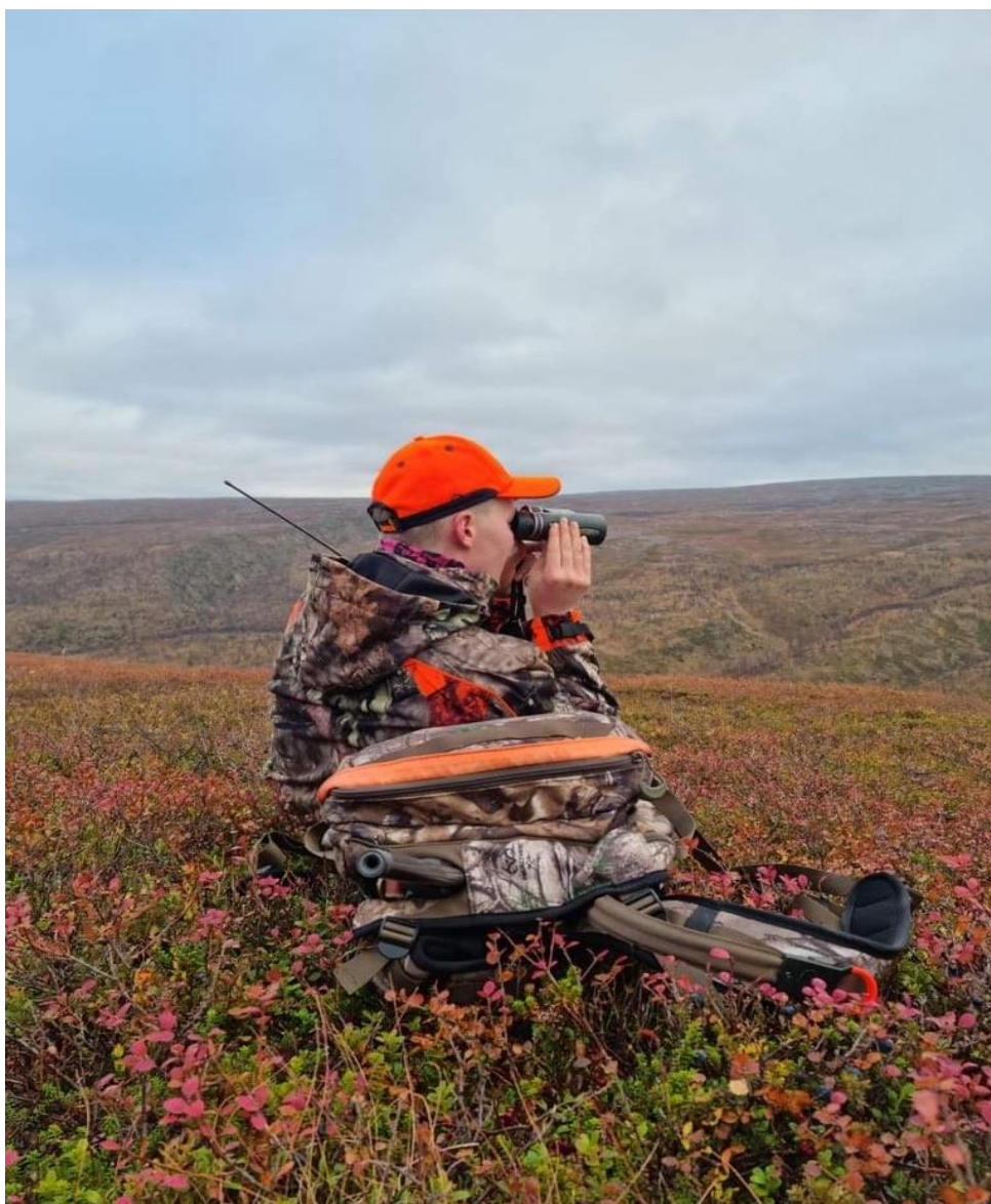
Foto: Introjakt for ungdom