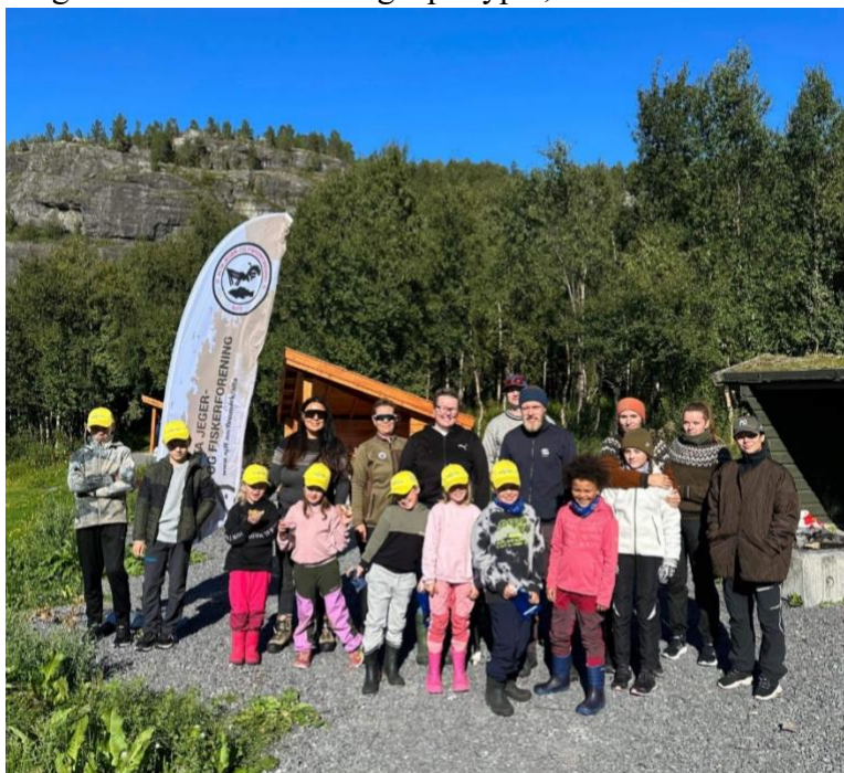
Foto: Fiskesommer-arrangement i Alta JFF 2023.

tilpasse seg nye vedtektsnormer og her i Finnmark mister vi dessverre noen foreninger. Dette blir spesielt de minste lokallagene, de som ikke har vært aktive på flere år. Alle lokallag er kontaktet om dette og enkeltmedlemmene vil få mail med informasjon og tilbud om å bli tilknyttet andre lokallag eller sentrallag. På Sørøya i Vest-Finnmark har driftige ungdommer tatt tak i dette og Hasvik JFF har til nå firedoblet medlemsmassen på kort tid. Riktignok fra 3 til 12 medlemmer, men de er i gang og det er skikkelig gledelig. Kanskje Hasvik JFF blir nominert til Foreningsprisen i NJFF på Landsmøtet i november 2024? Nomineringsfristen er 15. juni