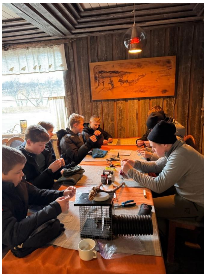
Villmarksleir – lager rypesnarer og lærer om fellefangst.

På områder hvor det er et felles ståsted rundt høringsuttalelser er det FNF-Finnmark som har skrevet høringene på vegne av interesseorganisasjonene. NJFF Finnmark har bidratt med faglige innspill i flere av sakene.