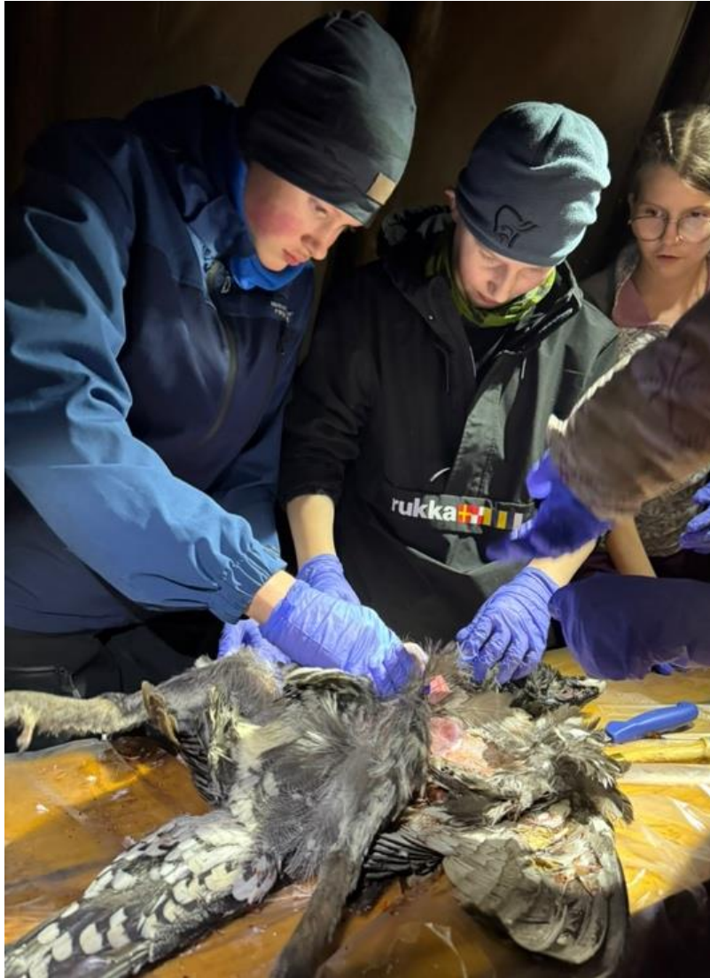
Villmarksleir – flåing av storfugl.

Å ta vare på villaksen og sjørreten er et ansvar vi har på vegne av framtidige generasjoner. Kunnskap og løsninger finnes. Vi må derfor forvalte disse ressursene med kunnskap og langsiktighet til beste for naturen.