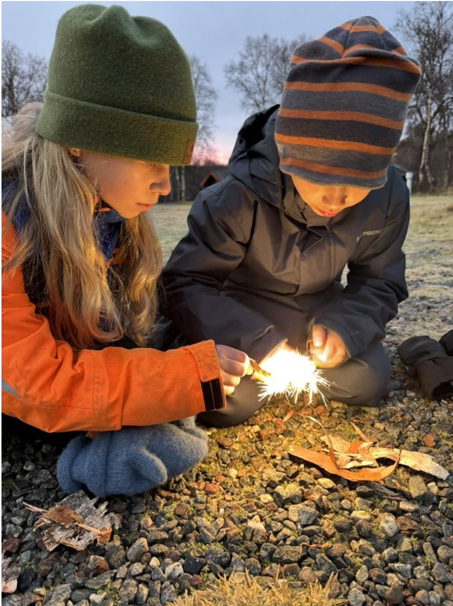
Villmarksleir Neiden Fjellstue 2025.