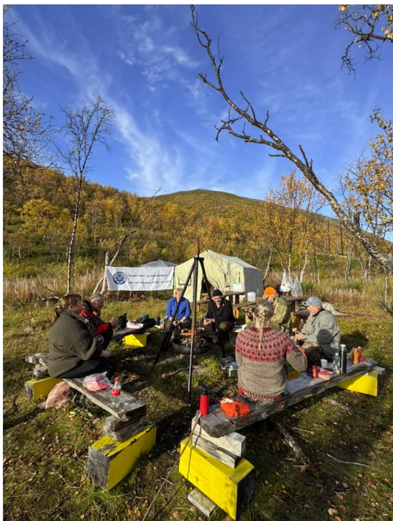
Introjakt - elgjakt for damer