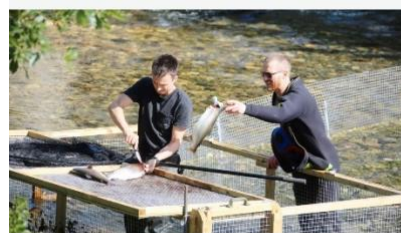
Over 120.000 pukkellaks tatt ut av norske elver 📌

Og nettopp det å ha med oss lokallag med lokalt engasjement spredt utover hele fylket er vår store styrke. Folk som kjenner sitt område, med kunnskap om hvordan vi som forening best kan bidra til å forvalte vår lange og stolte kulturarv basert på jakt, fiske, fangst og høsting i naturen. Vi vet hvor vi bor og vi vet hvor heldige vi er her i Finnmark, som har muligheten til å benytte oss av hele Fylkets rike og unike natur med en reell utøvelse av allemannsretten.