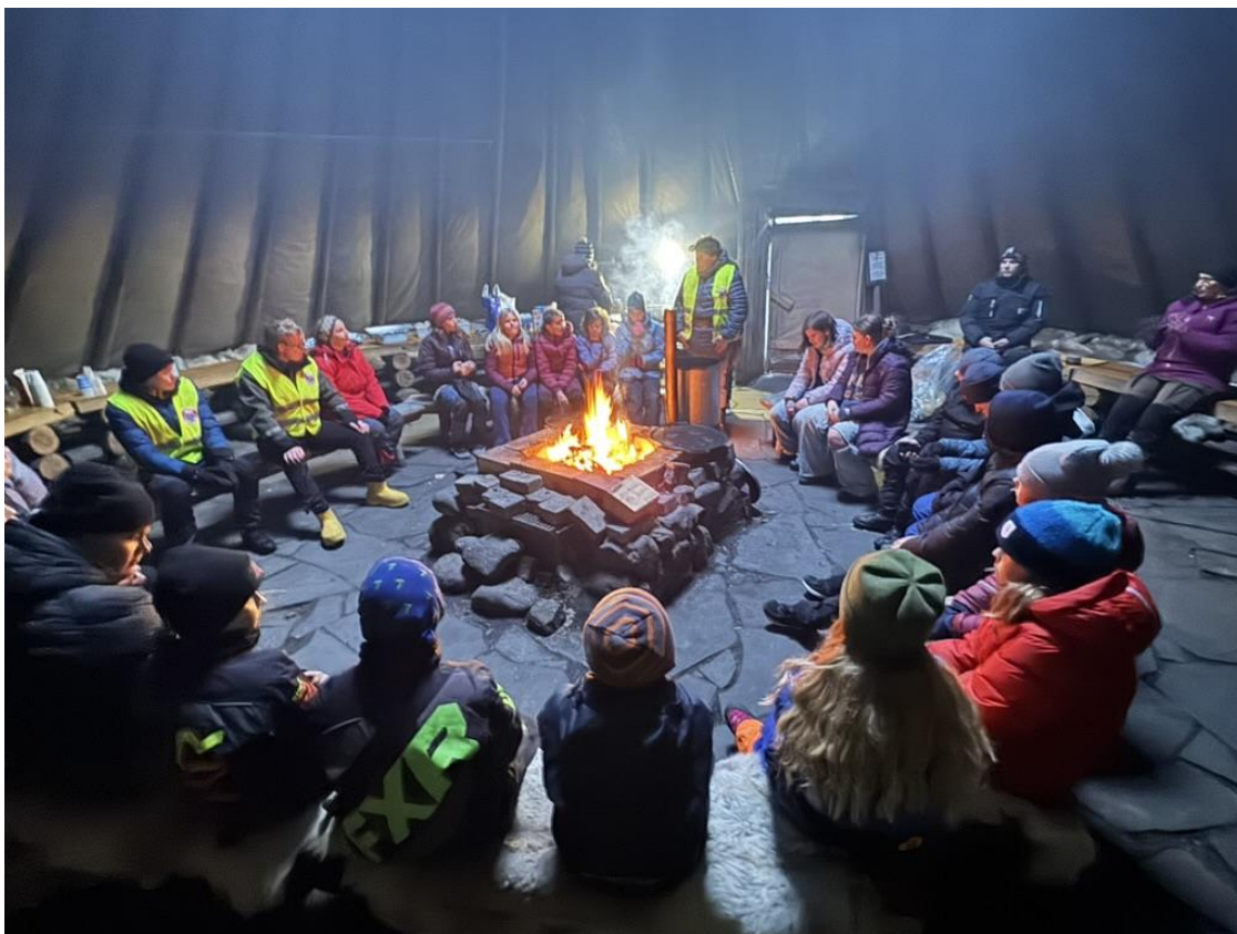
Villmarksleir – samling i stor lavvoen.