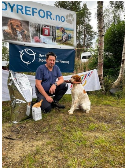
Prøvens beste FK hund