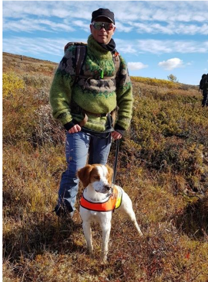
Årets hund UK 2022: