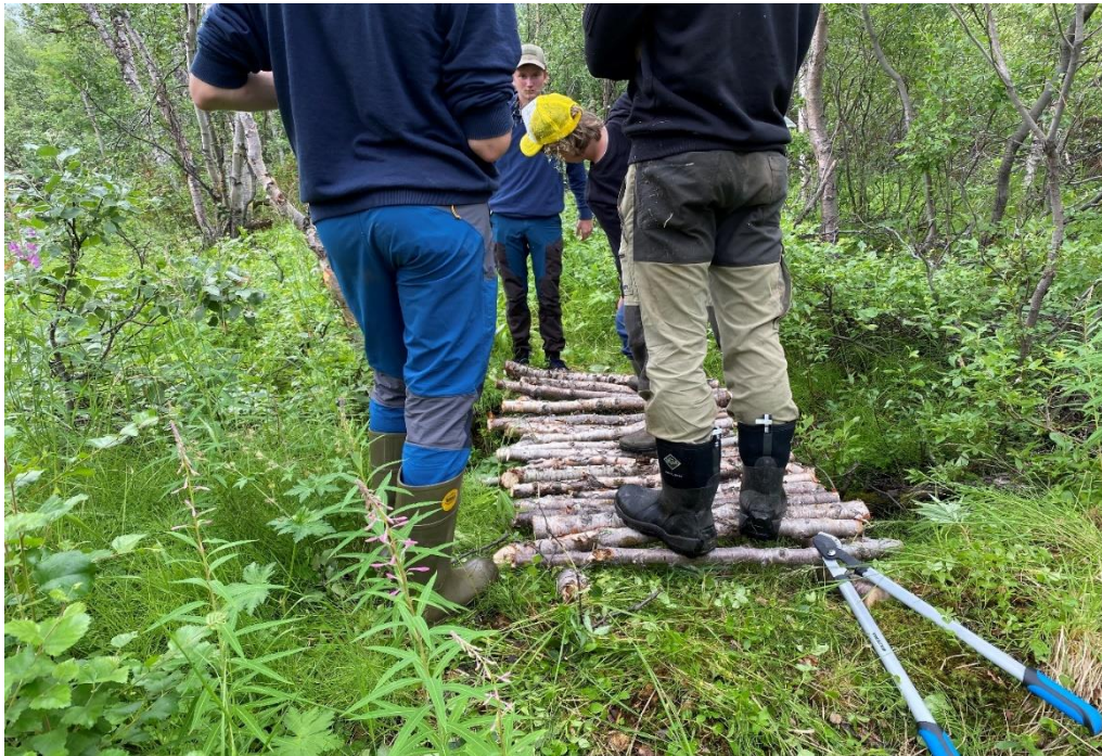
Her fra rydding av stier og litt byggearbeid

Videre fikk begge gruppene male. Vi løste maleoppdrag på bivuakker og på leirduebanen til Sør-Varanger Jeger og fiskeforening. Her sørget vi for at de fikk jobbe selvstendig, da arbeidet med maling foregikk på bakkenivå. Vi ville at de skulle ha en viss læring med å jobbe uten at noen «hengte» over skuldrene på dem. Dette løste de på en grei måte.