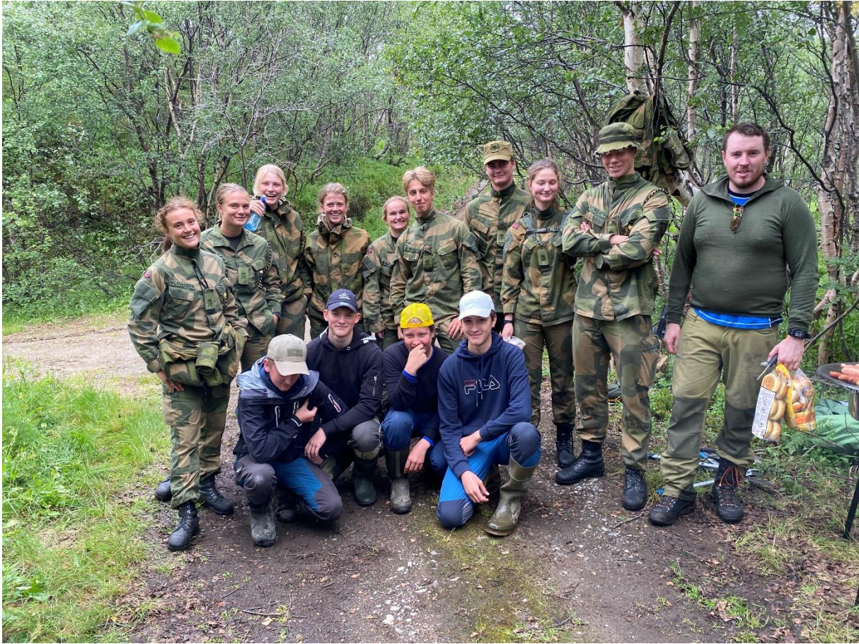
Her fra Grense Jakobselv sommerjobb sammen med Grensekompaniet.

Første gruppe fikk en flott dag i Grense Jakobselv der Sør-Varanger Jeger og fiskeforening hadde et samarbeid med Grensekompaniet om rydding av stier og fiskeplasser. Dette var et opplegg som de satte stor pris på.