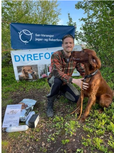
Beste AK apport