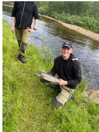
Ungdomsfiske med fangst i Gensen.

Grense Jakobselv ble i likhet med de andre elvene SVJFF forpakter, stengt for alt fiske fra og med 1.august. Dette etter observasjoner av dårlig oppgang og lite laks i elvene.