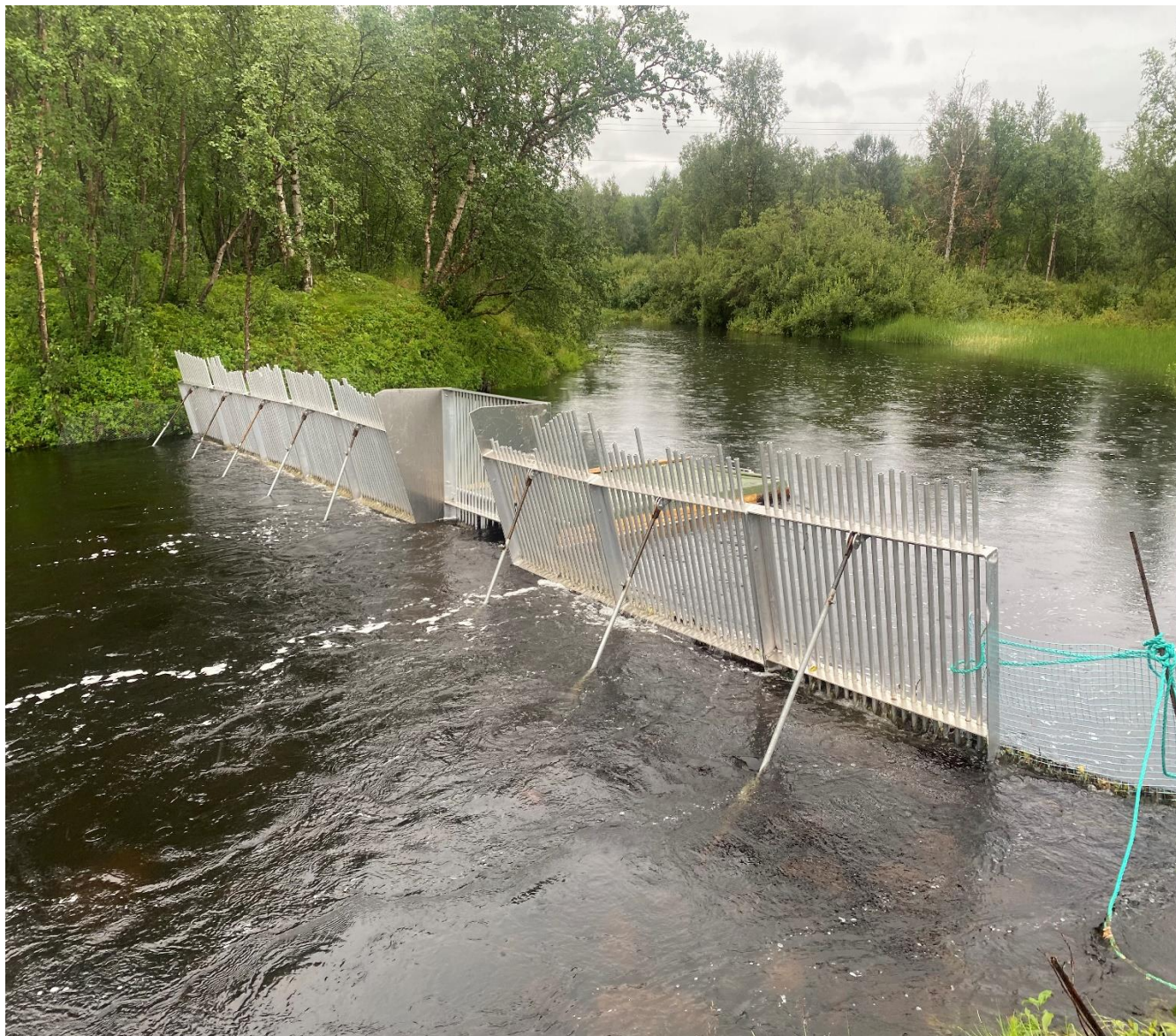
Laksefella i Karpelva

Høsten 2021 bevilget Sør-Varanger kommune midler til bruk for sommerjobb for ungdommer. Disse midlene ble brukt i samarbeid med SVJFF for å forberede russelaksinvasjon i 2023. Det ble satt opp laksefelle i Karpelva og jobb med forefallende arbeid.