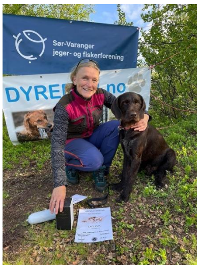
Beste AK hund sammenlagt utstilling og apport: