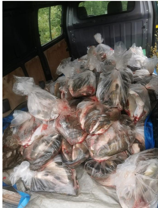
Fisk til dumping

For å klare å få unna de enorme mengdene med fisk kreves det en stor innsats, der tillatelsene for dumping fra Statsforvalter, FEFO og lokale myndigheter prinsipielt trolig var ment som en god ide. I praksis ga det oss betydelig merarbeid, og gjorde arbeidet enda mer krevende. I kjølvannet av at vi - som samfunnsaktører - synes det var vanskelig å kaste så store mengder fisk, eventuelt gi denne gode ressursen vekk som hundemat, tok vi på oss en begrenset salgssrolle. Inntekten for dette vises i regnskapet, på 33 976 kroner. Salgsarbeidet ble gjort fordi a) forsvare noen kostnader og ta igjen noe tapt fiskekortsalg slik at foreningen ikke ble insolvent, b) kunne bidra til å skape en form for markeds mekanisme og vise at dette er en ressurs (både til næring, publikum og politikk) og c) få unna noe av massene for å slippe dumping/avhenting. Salget i seg selv ga oss også merarbeid utover det å drive fiskeforvaltning, og er i så måte ikke noe vi ønsker å drive med som frivillige aktører.