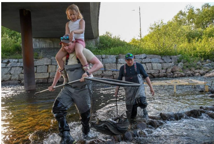
Munkelva og besøk av mininster

Vi ber dere ta høyde for at det også kan komme fisk i 2022, og at denne bestanden trolig vil vokse. Derfor må tempoet med forskning og kommersialisering skaleres opp. Samtidig må dere sette fokus på kostnadsnivåene som ligger rundt dette arbeidet. De frivillige foreningene klarer neppe å bære dette spesielt mye lengre.