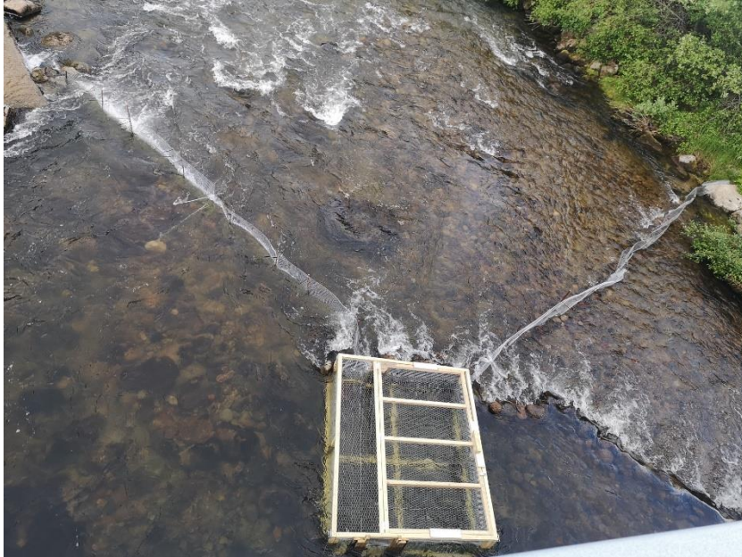
Fella og ledegjerde