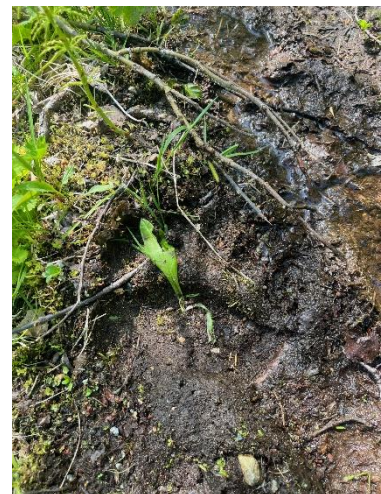
Figur 2 Det er mange som farter langs elva...

Willy Nilsen har vært fast fiskevakt over sommeren og har gjennomført kontroller i de mest populære fiskeområdene, samt tidvis andre deler av elva. I tillegg har SVJFFs ambulerende vakter gjennomført oppsyn i hele elva, og oppover sone 3, ved bruk av ATV. SVJFF har dispensasjon til og med 2024 for bruk av ATV til oppsyn langs øvre deler av elva. I øvre deler har det vært ekstremt lav aktivitet, og ikke minst lite laks, så det antas å være tilstrekkelig med periodevise kontroller her.