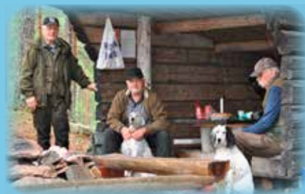
Livlig hundepprat i gapahuken etter en treningstur med hundene.