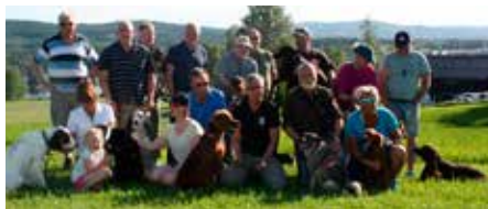
Bildet er fra den offisielle åpningen 6. juni.

Vi er fornøyd med interessen rundt anlegget så langt, men det er plass til flere og vi håper mange vil benytte seg at mulighetene både til dressurtrening og trening på tamfugl i tiden framover. Oversikt over organiserte aktiviteter legges ut på hjemmesiden fortløpende.