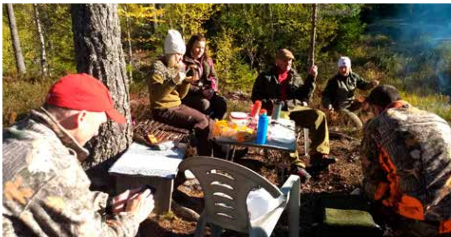
Hele gjengen samlet til lunch