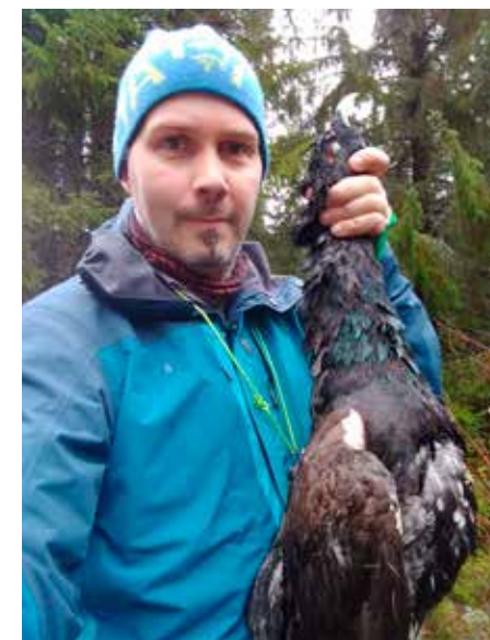
Meg med tiur