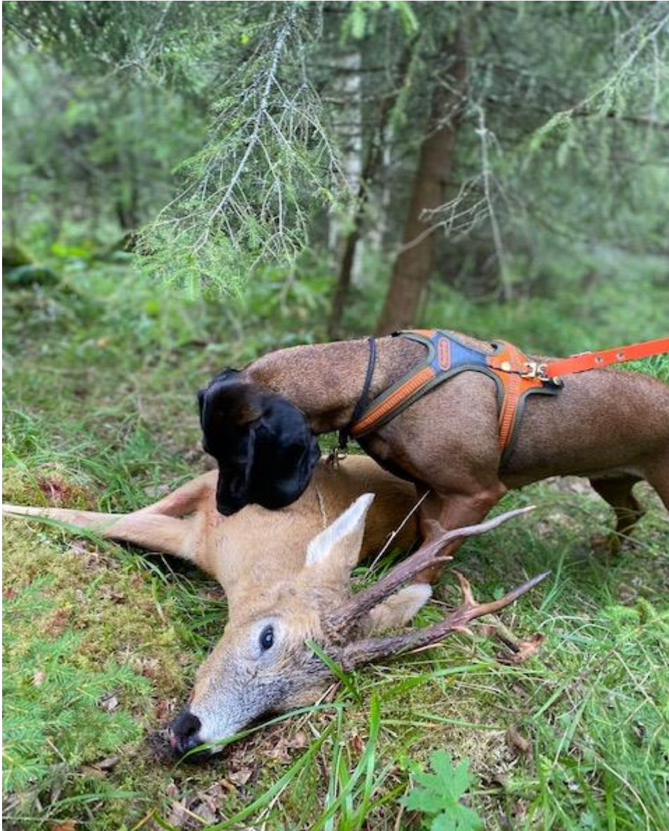
Frøken på oppdrag en tidlig morgen.