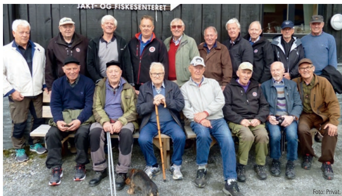
Seniorgruppa i Vang på besøk på Jakt- og Fiskesenteret og bjørneparken på Flå.

Vang Jakt- og Fiskeforening er med sine nesten 800 medlemmer Hedmarks største lokalforening.