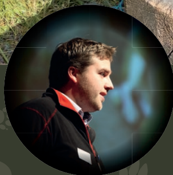
Landsmøte side 9