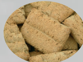
SUNT & GODT

Importør: Porthos Trading A/S, PB. 739, 1733 Hafslundsøy | Tlf. 69 15 88 15 | post@porthos.no | www.porthos.no