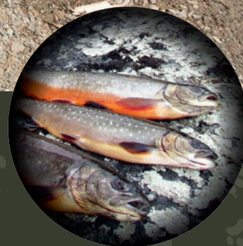
Sportsfiskesatsing side 19