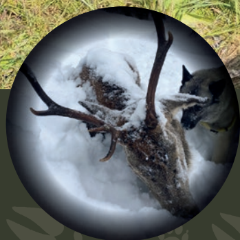
Hard vinter for hjorteviltet side 6