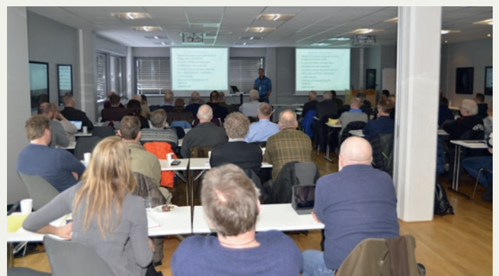
Mye folk på fagdagen!