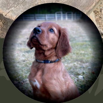
Kurs side 12