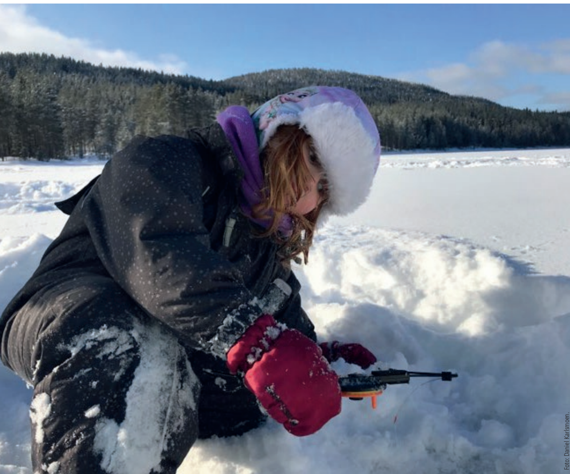
Den yngste deltakeren var 3 år gammel.

Det ble hjemmedominans under fylkesmesterskapet i isfiske i år.