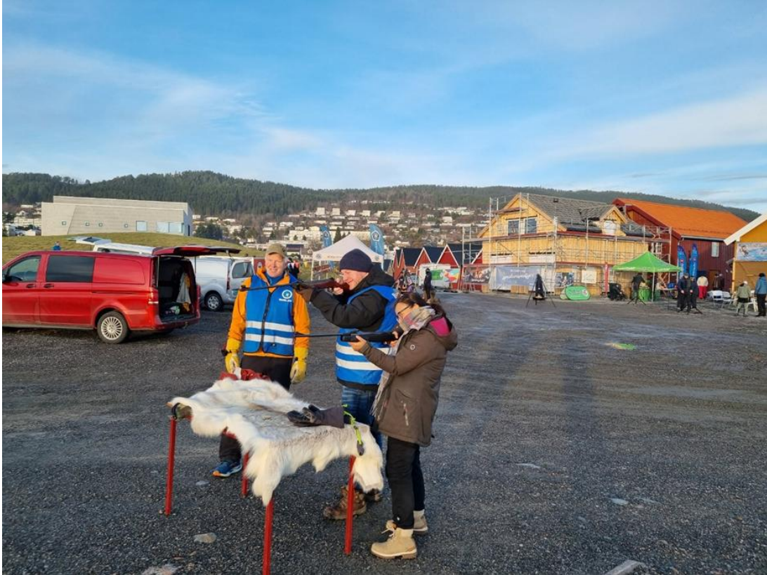
Luftgeværskyting, bestandig en populær aktivitet, spesielt til barn. Yngre enn de her.