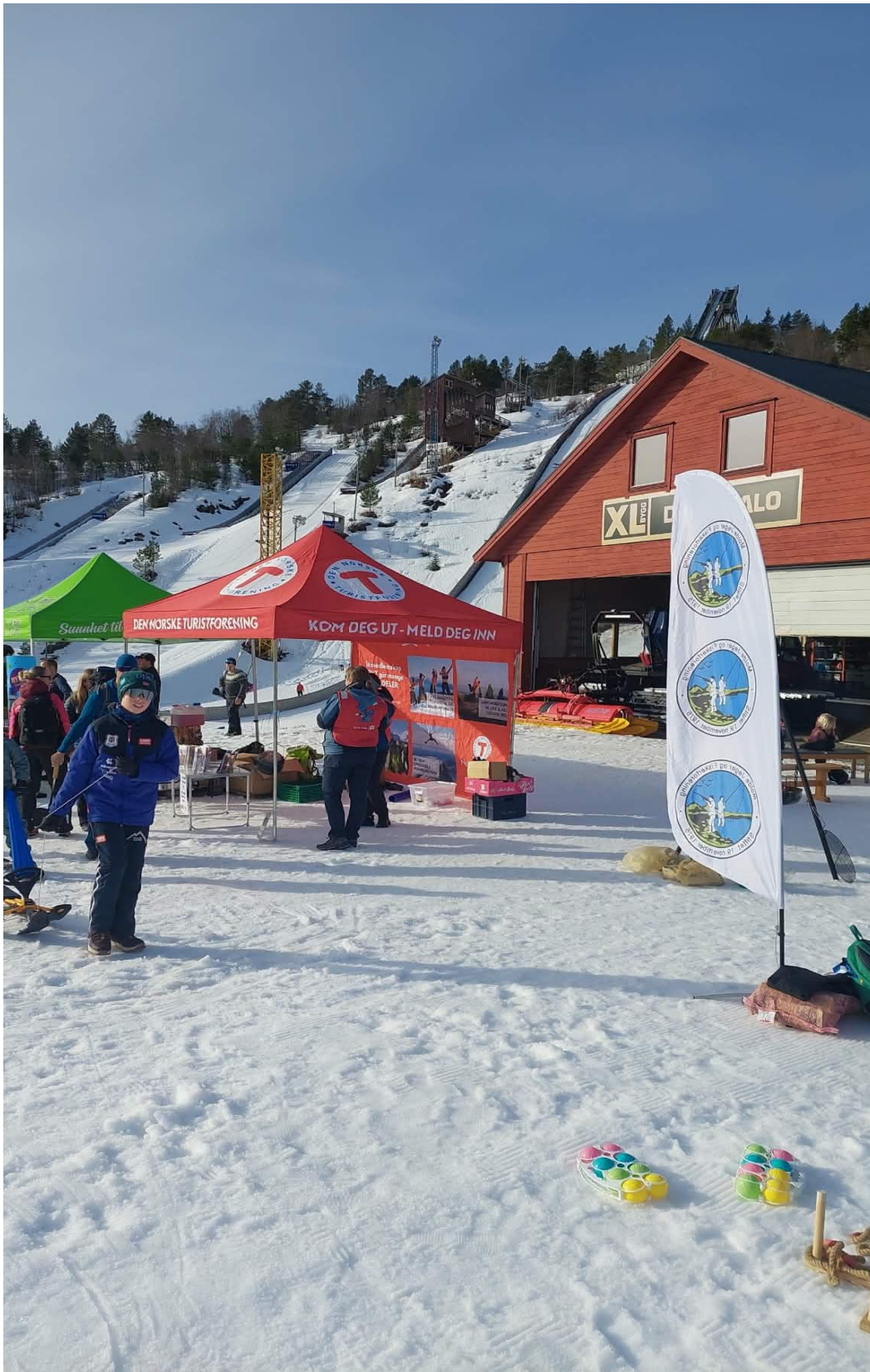
Aktivitet i samarbeid med Turforeningen i Skarbakken