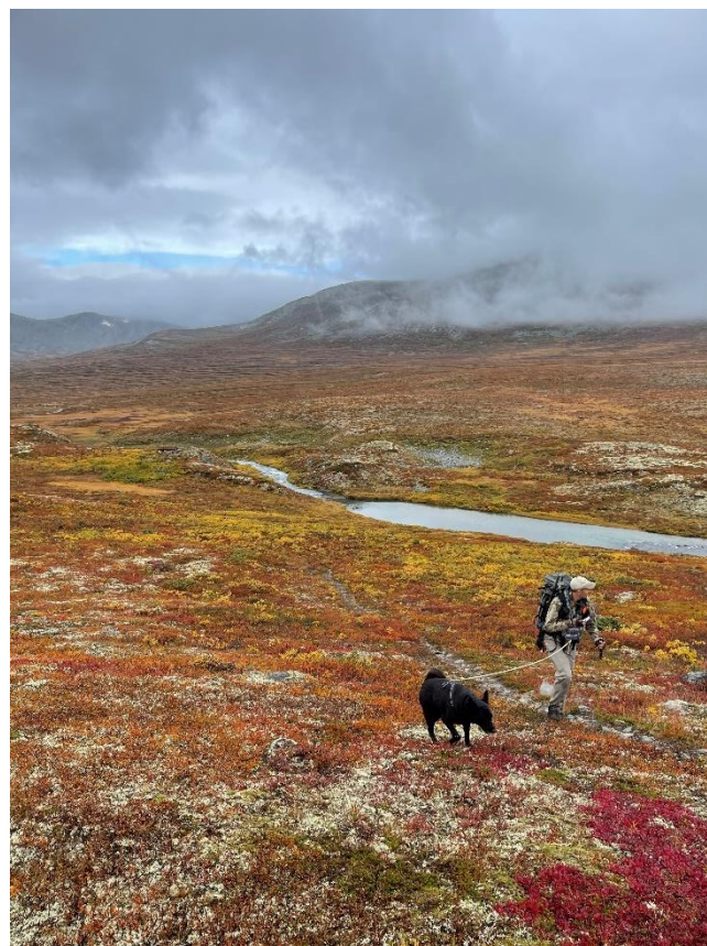
Villreinjakt i Snøhetta Øst