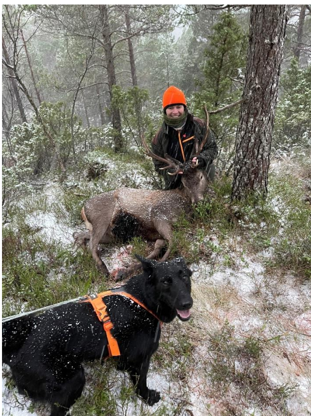
6 Restjakt på Frei

20 stk som deltok på dette seminaret som ble avholdt i Mars.