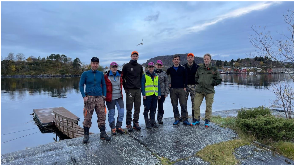
1 Introjakt hjort på Frei

NJFFs landsmøte 2006 vedtok et verdigrunnlag for organisasjonen. Dette er det ideologiske utgangspunktet for all virksomhet i organisasjonen og for utøvelsen av jakt og fiske. Nedenfor gjengis verdigrunnlaget: