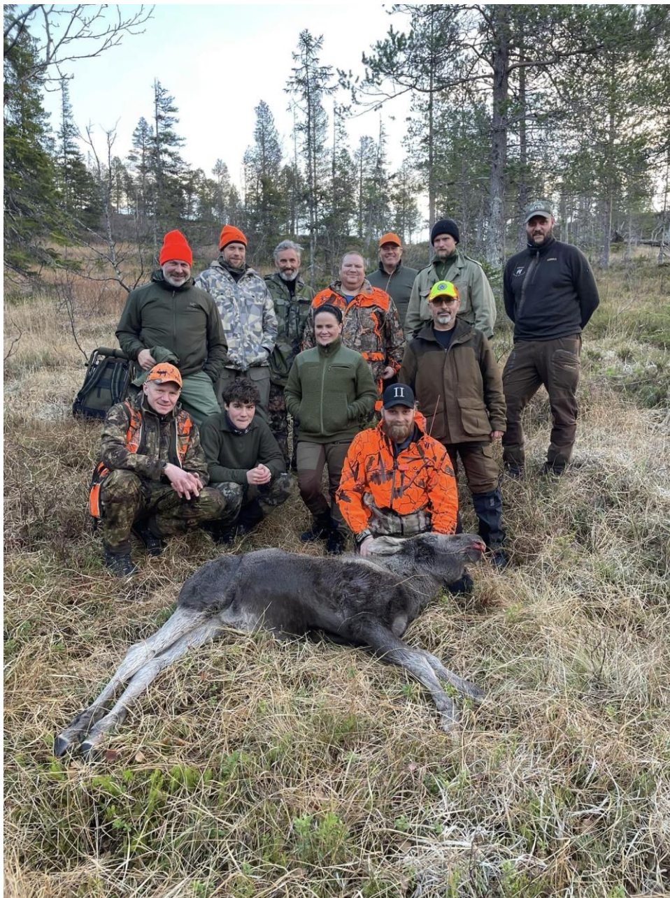
7 Introjakt Elg på Høylandet