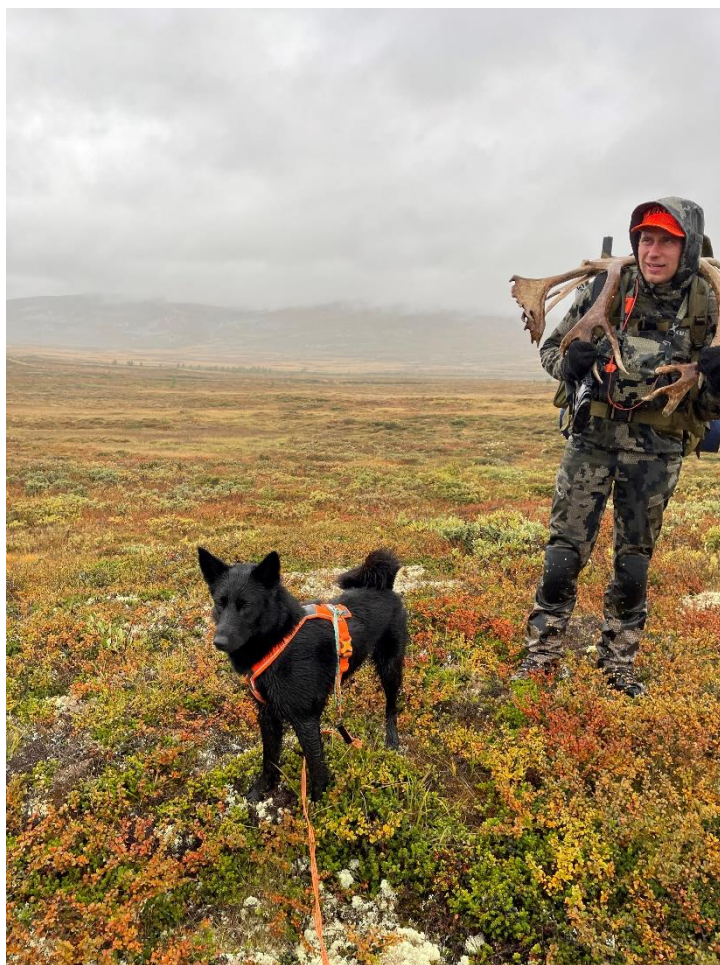
4 Introjakt Villrein i Snøhetta Øst

denne jaktdagen, og resultatet ble mediedekning på nettavisen, innslag på distriktsnyhetene, samt innslag på Norge Rundt.