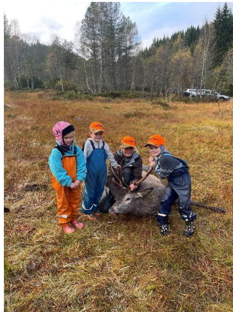
Hjortejakt med barnehager på Halså