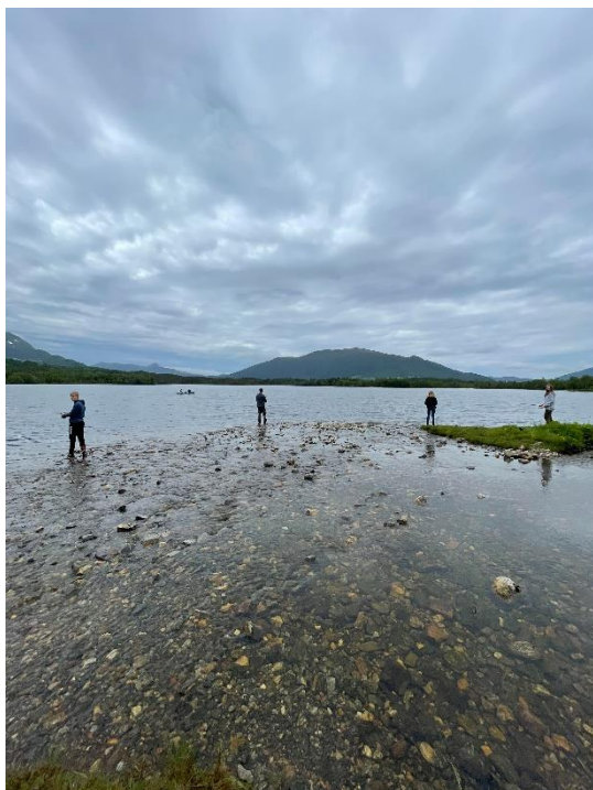
1 Fiske med skoleklasse - Vassgårdvatnet