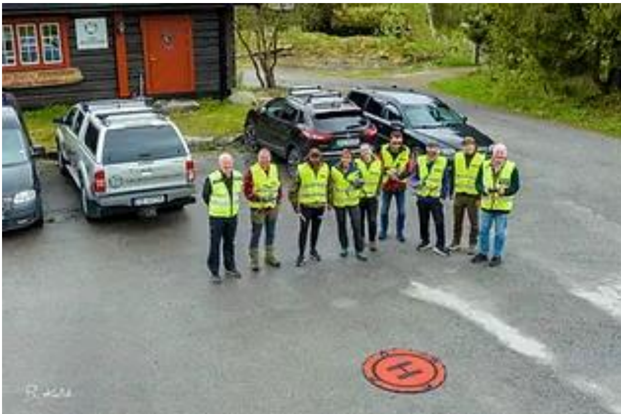
4Dronepiloter på kurs