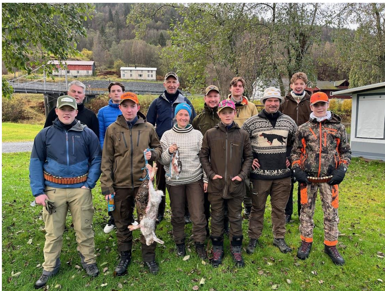
1 Jaktcamp i Høstferien, i samarbeid med Eide JFF.

NJFFs landsmøte 2006 vedtok et verdigrunnlag for organisasjonen. Dette er det ideologiske utgangspunktet for all virksomhet i organisasjonen og for utøvelsen av jakt og fiske. Nedenfor gjengis verdigrunnlaget: