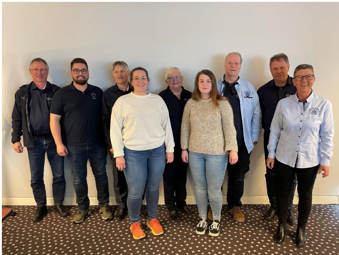
8Styre og utvalg 2023 (de som var tilstede)

Årsmøtet vedtar virksomhetsplanen for 2024 som forelagt