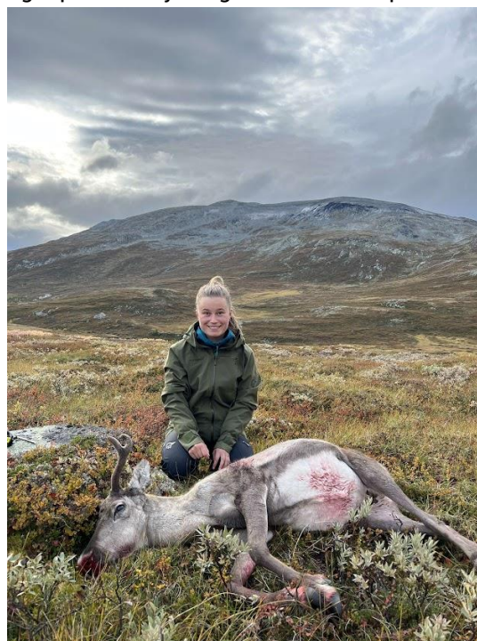
Introjakt på villrein – Skamsdalen, Snøhetta øst