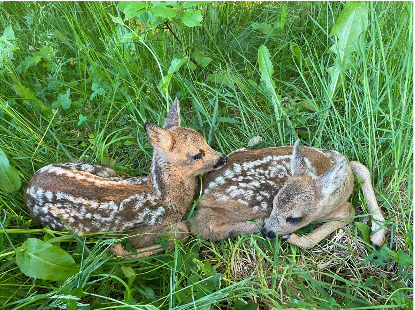
Tvillingje rådyr reddet fra slåmaskinen

Årsmøtet vedtar å videreføre avtalen med ekstern statsautorisert revisor