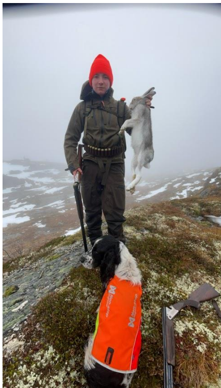
6 Jaktcamp i høstferien

lokalforeninger, så vi vil anbefale alle lokalforeninger å få sendt en eller flere representanter til neste års konferanse. BUK 2024 arrangeres i sommer på Alta Folkehøyskole.