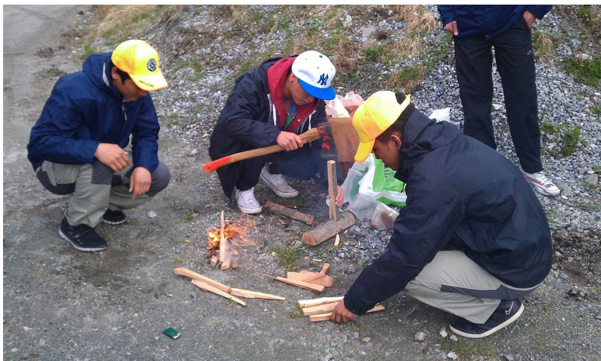
Båltenning innvandrere ungdommer