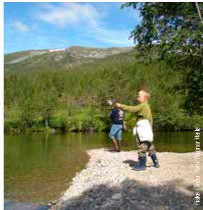
Fiske i Toåa.