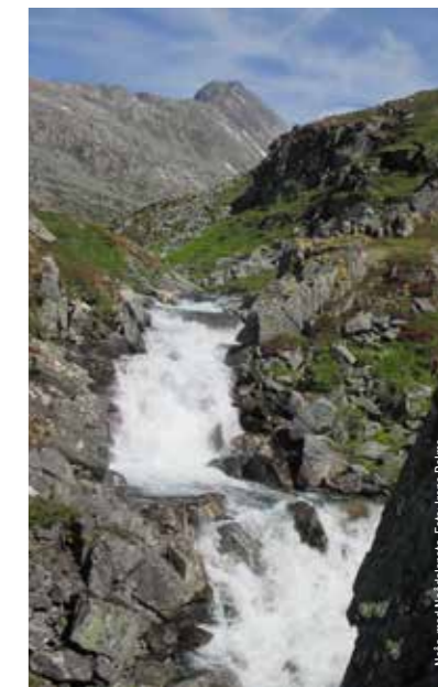
Neåa med Niekastanota.

Vis hensyn i naturen slik at Kårvatn også i framtida kan være referanseområde som Europas reneste.