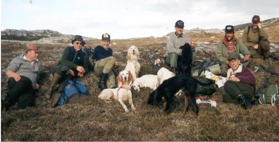
Jegertreff og kaffestund på baksiden av Tverrvola i "gamle" dager.