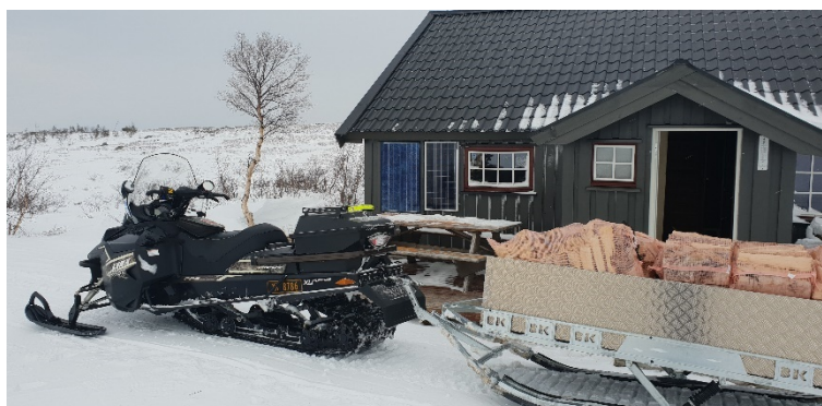
Transport av ved og varer til hytta