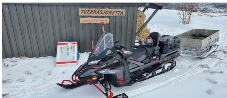
Transport av ved, vinduer og varer til hytta

Penger i "postkassa" er det heller ikke blitt noe mindre av mot tidligere år!!