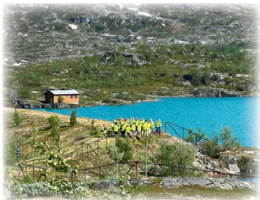
Norddalen Dam og deltakere på befaringen.