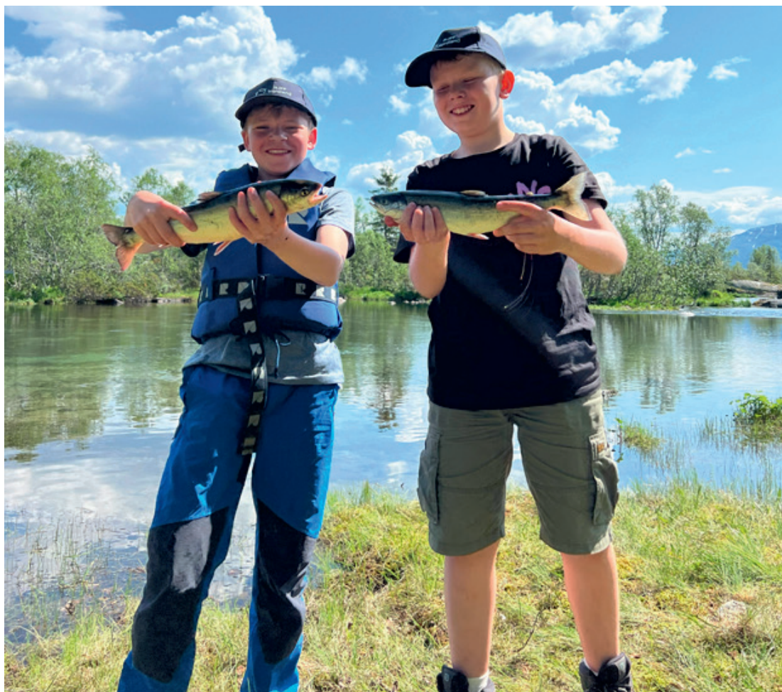
Såå fornøyde blir man når fiskelykken er på plass! To glade gutter med hver sin sjørrøye.

anadromt vassdrag som er kjent for sin gode bestand med sjørrøye!