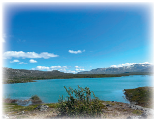
Norddalen inn mot Sverige.

Det foreslåtte vannlippet vil gi et produksjonstap like i underkant av 40 GWh, sammenligna med i dag. Dette er ikke et ubetydelig produksjonstap, men NVE har i denne saka lagt stor vekt på hensynet til miljøverdiene i vassdraget. NVE legg vekt på at minstevassføring vil gi vesentlige miljøforbedringer i et viktig lakse- og sjørretvassdrag og at Skjomen er prioritert i nylig godkjent regional plan for vannforvaltning.»