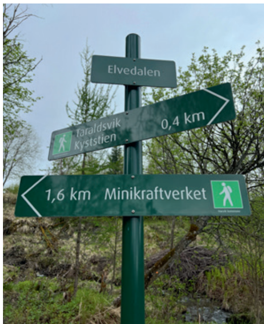
Flotte skilt hadde kommet opp i elveparken, med mange muligheter for ivrige turvandrere.

fikk vi sett elveparken og de tiltak som hadde blitt gjort gjennom en liten vandring. Kort vei fra hotellet i Narvik sentrum kom vi frem til et grønt pusterom, med en fantastisk flott liten elv. Elveparken var virkelig en fryd for øyet, med universell utforming slik at alle kunne nyte nært naturen på en flott måte.