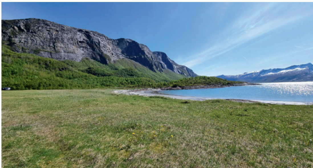
Strandsone fra Sandhornøy

Forum for natur og friluftsliv (FNF) Nordland er et samarbeidsnettverk for 14 natur- og friluftsansjoner i regionen. Vårt mål er å ivareta natur- og friluftsansjone i Nordland fylke ved å styrke og fremme organisasjonenes arbeid, være en møteplass for samarbeid og en arena for kompetansebygging for natur- og friluftsansjonene med sitt virke i regionen. Organisasjonene har sluttet seg til samarbeidsforumet gjennom en tilslutningserklæring, og NJFF Nordland er én av de disse organisasjonene.