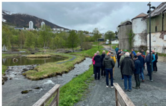
Befaring i Elveparken.

fikk vi sett elveparken og de tiltak som hadde blitt gjort gjennom en liten vandring. Kort vei fra hotellet i Narvik sentrum kom vi frem til et grønt pusterom, med en fantastisk flott liten elv. Elveparken var virkelig en fryd for øyet, med universell utforming slik at alle kunne nyte nært naturen på en flott måte.