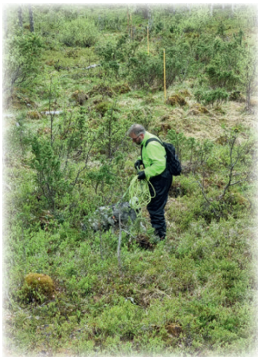
Blodsporsøk skal gjøres grundig