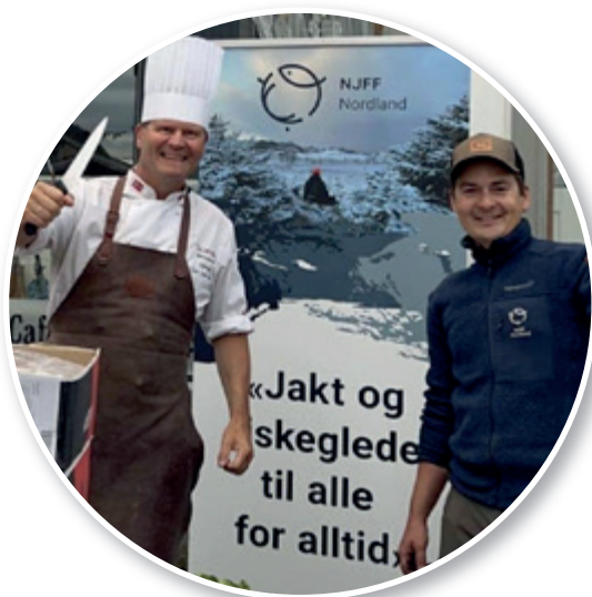
Fornøyd Villmarkskokk og Friluftseidler.

Til sammen 350 ungdommer var samlet i Mosjøen disse dagene, og vi fikk møte ungdommene en ettermiddag i ærverdige Sjøgata. Midt blant de gamle byggene lagde vi et kjøkken, med bål og god stemning. Her kunne ungdommene lage seg Souvas, og med en viss egeninnsats smaker maten ekstra godt! Ungdommene skulle videre på konsert denne dagen, men før dette sto