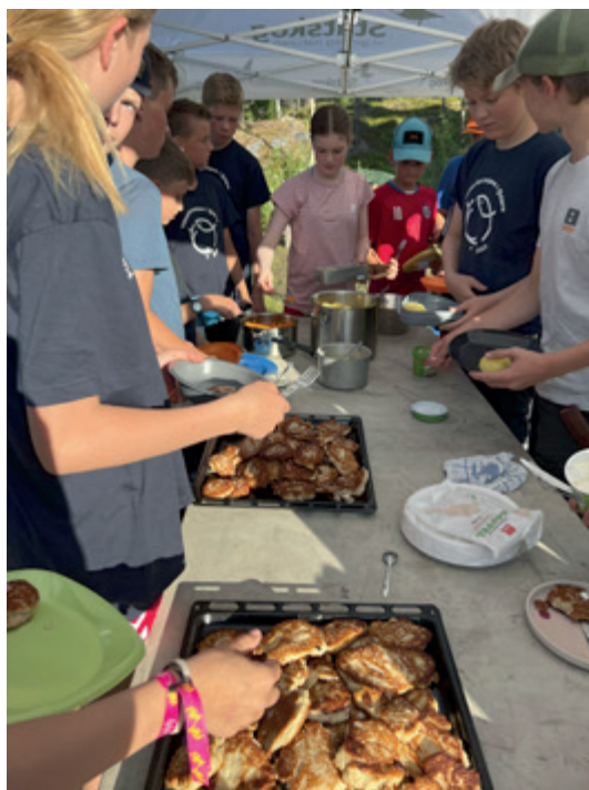
Ingenting smaker så godt som fiskekaker fra selvfanget fisk!