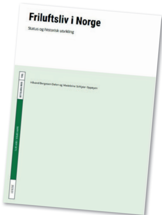
Friluftsliv i Norge – Status og historisk utvikling. Rapport 2023/31 (SSB.no).

Friluftslivet står sterkt i Norge og det appellerer til de aller, aller fleste i befolkningen. Det gir økt livskvalitet og det har store helsegevinster. Samfunnet har ikke råd