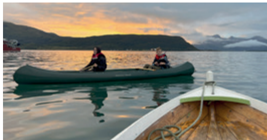
Kanopadling i flotte omgivelser på Nesna.

kunne ungdommene padle og leke seg i vannet under trygge omgivelser.