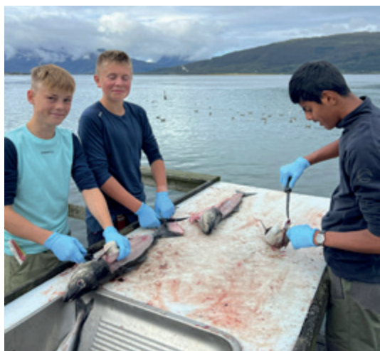
Sløyving av fisk etter fisketur med «MS Havung».

Motiverte ungdommer lagde fiskekaker, kuttet grønnsaker og forberedte en fantastisk middag sammen. Når middagen var fortært, og oppvasken var tatt ble det kort tid til middagshvile. Neste økt i timeplanen var Coastteering. Alle fikk utlevert våtdrakter, sokker, hansker og redningsvest. En stor SUP ble blåst opp og ut på havet