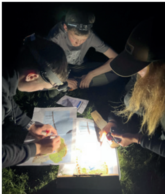
Å kunne orientere seg i mørket kan være en god egenskap når høstmørket kommer.

Søndag morgen startet med rydding va hytter etter frokost, og enkelte var ekstra spente denne dagen. Hovedaktiviteten var nemlig klatring. Selv om enkelte var svært usikre på om de ønsket å klatre, kunne samtlige av ungdommene ved hjemreise være fornøyde med egen innsats i klatreveggen. En innholdsrik helg på Nesna, med mange fornøyde ungdommer!