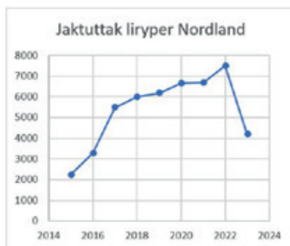
Figuren viser estimert antall liryper i Nordland basert på resultater fra rypetakseringen (t.v) og antall felte liryper det enkelte år fra 2015 - 2022, samt foreløpig innrapporterte fangsttall pr. 10 oktober 2023 (t.h).