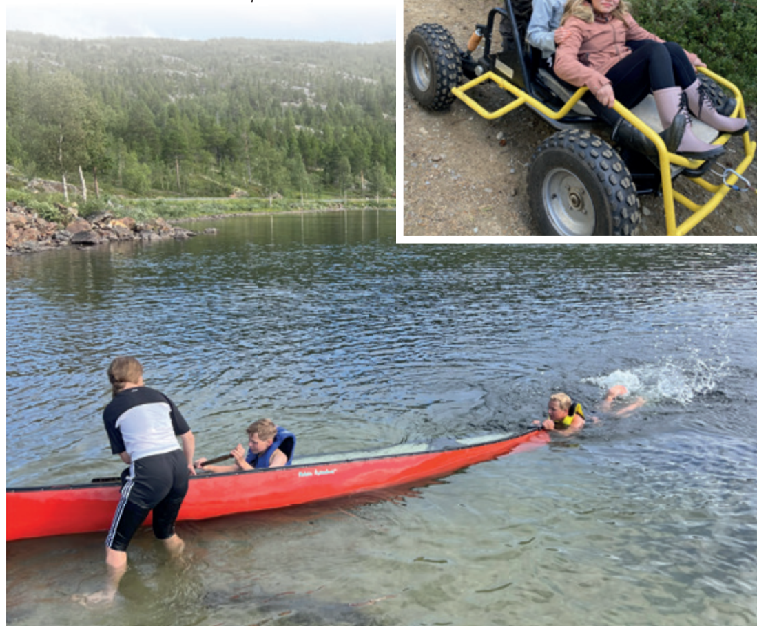
En kano fylt med vann gir timevis med aktivitet!