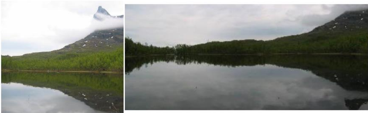
Pumpvannet juni 2006; Foto Knut Aune Hoseth

Pumpvannet (Andrevannet) er drikkevannsmagasin til Djupvik, og også dette vannet er oppdemt. Oppdemmingen har ført til ustabile bunnforhold, spesielt i den delen av vannet som ligger mot Tøttatoppen. I denne delen av vannet anbefaler vi ikke vading, og det bør utvises forsiktighet også ved eventuell vading i andre deler av vannet.