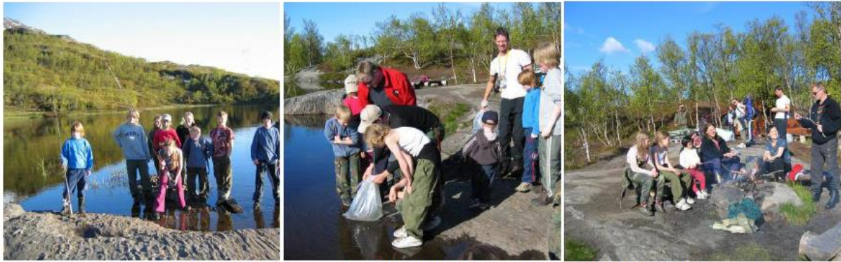
Fiskeutsetting i Førstevannet og tur med Fiskeklubben i NOJFF

Pumpvannet (Andrevannet) er drikkevannsmagasin til Djupvik, og også dette vannet er oppdemt. Oppdemmingen har ført til ustabile bunnforhold, spesielt i den delen av vannet som ligger mot Tøttatoppen. I denne delen av vannet anbefaler vi ikke vading, og det bør utvises forsiktighet også ved eventuell vading i andre deler av vannet.