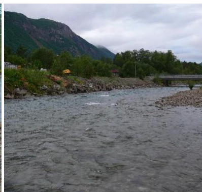
Fluefiske i Lakselva i 2007