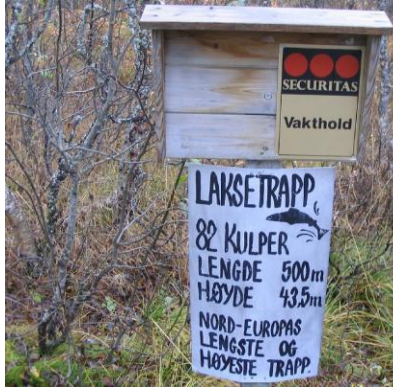
Info om laksetrappa

Lakseførende strekning i elva var opprinnelig ca 4 km, men på 80-tallet ble det bygd en laksetrapp som gjør at lakseførende strekning er økt til ca 7 km. Laksetrappa er Nord-Europas lengste og høyeste. Dalen ovenfor laksetrappa heter Skamdalen og i denne er det to vann, Lillevannet og Storvannet. Laksefisk passerer Lillevannet, men det er usikkert om fiskeoppgangen stopper ved et vandringshinder nedenfor Storvannet eller om laksefisk kommer seg helt opp til også dette vannet.