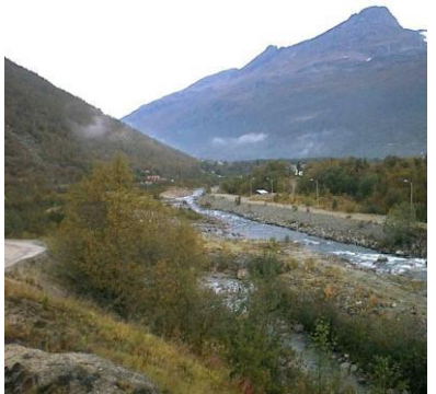
Nedre del av elva