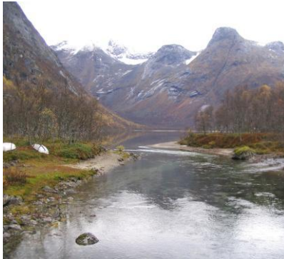
Utløp fra Storvannet øverst i Skamdalen

Lakselva har utløp innerst inne i Beisfjorden ca 15 km sørøst for Narvik. Fra Narvik kjører man sørover til Fagernes der man følger fylkesvegen inn til Beisfjord. I Lakselva er det mest sjørøret, men det er også litt laks i elva. Det anmodes om at laks som fanges gjenutsettes uskadd. Det er ikke tatt sjørøye i elva de siste årene.