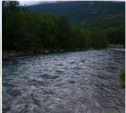
Nedre fiskestrækning

Lakselva er i liten grad påvirket av kraftutbygging (deler av Stubblielvas nedbørsfelt er overført til Sildvik kraftverk). Elvas nedbørsfelt ligger i fjellområdene mellom Rombaken og Skjomen. Det er få større vann, lite myrområder og mange blankskurte fjell i nedbørsfeltet. Dette fører til at vassdraget er en typisk flomelv hvor vannføringen stiger og synker raskt. Det var en stor skadeflom i elva høsten 1959, og etter dette ble de nederste 2 km av elva kanalisert og flomsikret. De siste årene er det gjennomført flere tiltak for å bedre vassdragsmiljøet langs denne nederste delen av vassdraget.