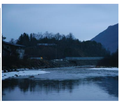
Ned mot brua i Beisfjord