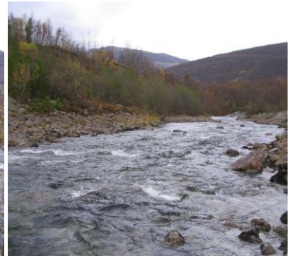
Elvestrekning nedenfor laksetrappa