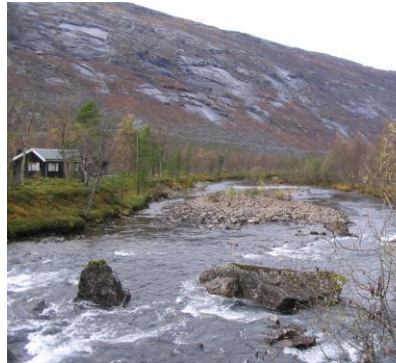
Elvestrekning mellom vatn i Skamdalen; Foto K.A. Hoseth