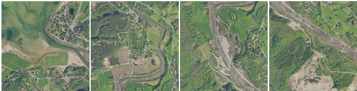
Flyfoto over nedre deler av Lakselva fra utløpet til venstre og opp til utløpet av Stubblidalselva til høyre.

Den nederste fiskesonen går fra utløpet og opp til utløpet fra Stubblidalselva, dette utgjør den nederste halvdel av elvestrekningen fra laksetrappa til utløpet. Elva langs denne strekningen vises på flyfoto under.