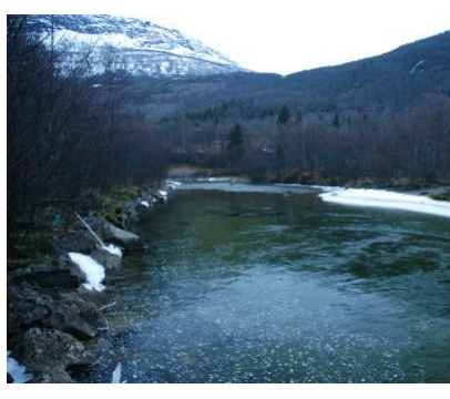
Nedre del av elva utenfor skileikanlegget