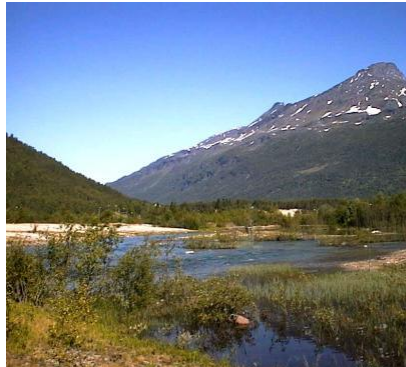
Oppvekstområde for ungfisk i nedre del