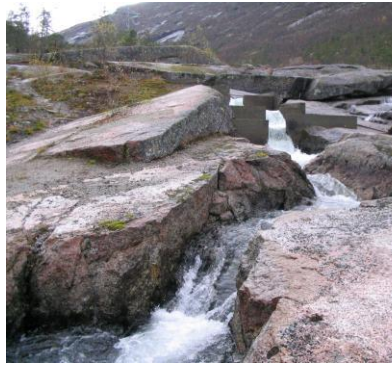
Deler av laksetrappa i Skamdalsfallene