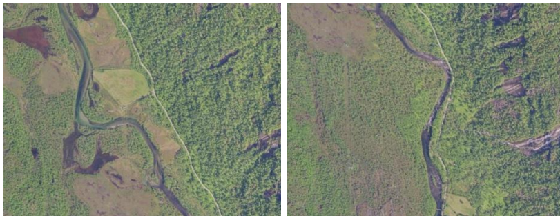
Flyfoto over øvre deler av Lakselva.