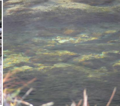
Sjøørretgyting i Lakselva