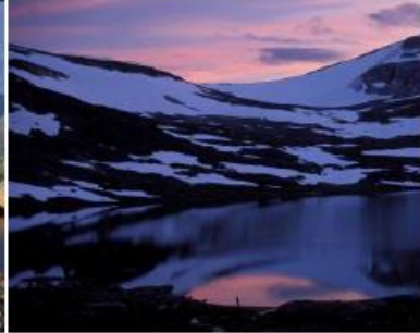
Kveldsstemming på Skjomfjellet; Foto Liv Marit Olaisen

Fra anleggsveien som går mot sørvest når du fine fjellområder straks du når over kanten fra Skjomdalen. NOJFF kultiverer flere av de første vannene du når på begge sider av anleggsveien. Dette er rene ørretvann.