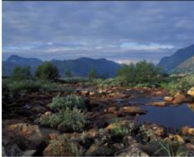
Utsikt over Nordalen