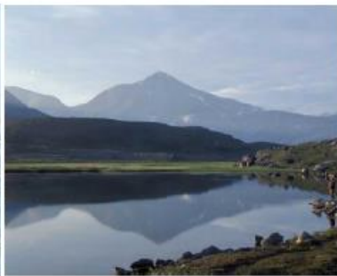
Vann ved Lapphågen som NOJFF kultiverer