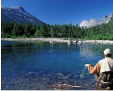
Fluefiske i Nordalselva; Foto Liv Marit Olaisen