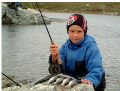
Røyefangst fra Gautelis juli 2005