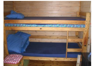
Senger i oppholdsrom