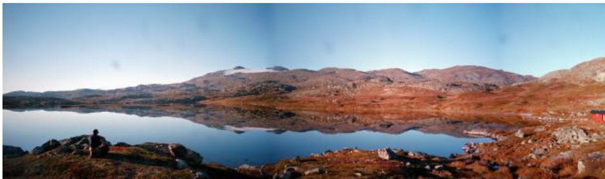
Sommerstemning ved Holmvann, gamle Holmvassbu til høyre

Småvatnan, med det samme man kommer opp av Urdalen på tur opp mot riksgrensen. Stien starter etter at man har passert broen over elven. Deretter går den på høyre side rundt et lite kjern, passerer like ved en hytte, før den tar av opp gjennom skogen. Den første biten kan være litt bratt, men deretter er det en flott tur langs siden av st. Rundfjell. Turen er ca. 5 km. og tar fra 1 til 2 timer, avhengig av form og hvor hardt man tar det.