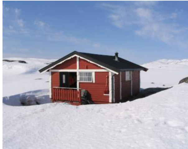
Nye Holmvassbu sett mot Store Holmvann