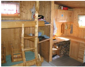
Køyeseng og kjøkenavdeling