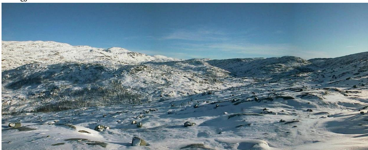
Bildet fra vinterruta er tatt mot øst og Holmvassbu ligger innenfor dalføret til venstre for linken på bildet

Man kan utmerket godt bruke samme rute som sommerstid, men mange foretrekker å starte fra Holmelv bru (Øvre Jernvann). Her følger man myrene på venstre side av elven, til man kommer frem til en smal dal. Deretter er det bare å følge elvedalen frem til Holmvann. Denne ruten er litt lengre (tot. ca. 8 km.), men slak og fin. Dessuten har man unnabakke hele veien ned igjen.