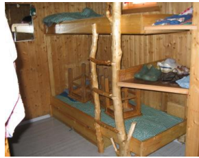
Køyeseng på andre siden