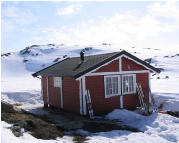
Nye Holmvassbu sett fra Store Holmvann

Saltdalshytte bygget i 1985 ved Store Holmvann på baksiden av Rundfjellet. UTM/ UPS : 34W 380621 7601690