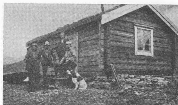
Hytten ved Gressvann, ca. 400 m. o. h.