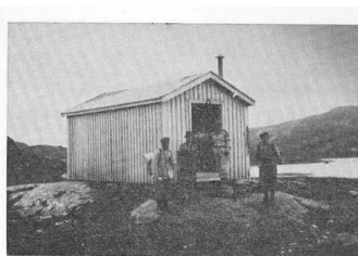
Hytta ved Næverfjellvannet.

I jubileumstidskriftet er det en beskrivelse av hyttene ved Gressvann, Holmvassbu og Nævra samt steinbua ved Kobberfjellvann som foreningen eier også i dag.