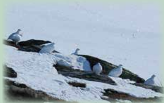
Avslapping i formiddagssola. Fjellryper.