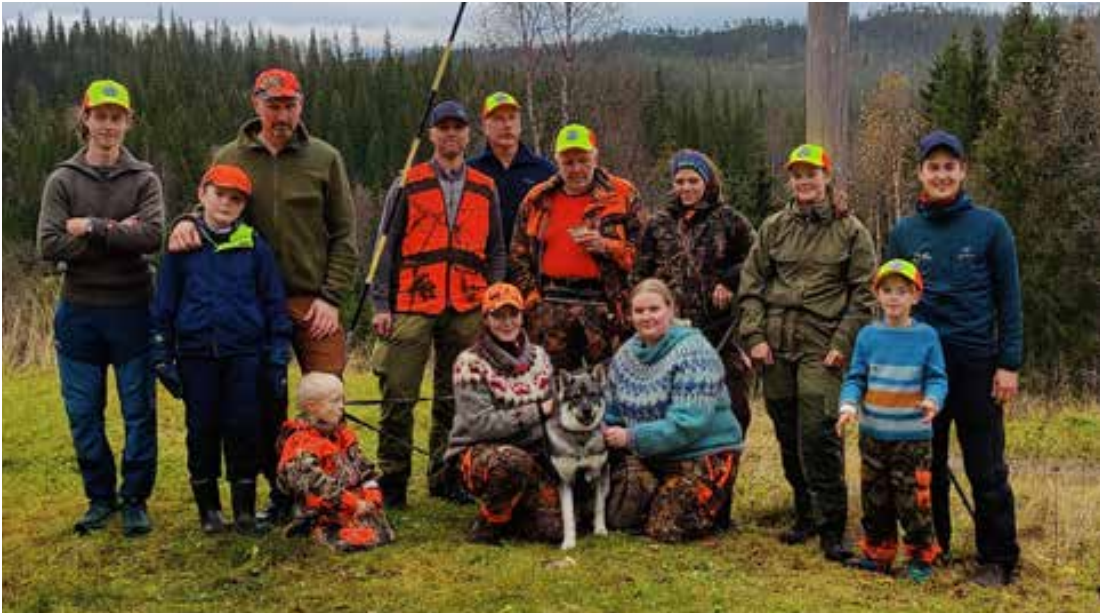
Instruktører og deltakere siste dag av introjakta i Hattfjelldal.

25. september er en merkedag for veldig mange jegere i Norge. Elgjakta står for tur og mange timer, dager og år med forberedelser skal endelig brukes i praksis. Vi i jeger og fisk jobber hele tiden med å rekruttere nye jegere inn til elgjakta. Våre introjaktkurs er en viktig del av dette, og år har vi arrangert til sammen 6 kurs fordelt på 3 helger.