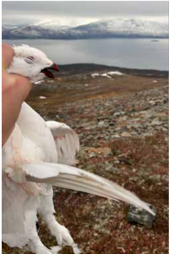
Nyskutt rype med Rössvatnet i bakgrunn.

Elgjakta ligger også foran skjema hvorav ved utgangen av oktober er 110 elg av 135 skutt i Salten, og på Helgeland er 391 av 552 dyr skutt.