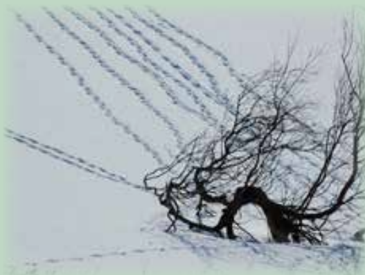
Rypespor viser stedet for frokost og morgenmøte.