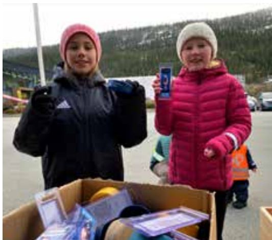
Fornøyde deltakere med sine premier fra naturstien.

Rundt om i hele Norge ble utebursdager gjennomført med aktiviteter for både små og store. Det ble servert god mat rundt bålet for å gjøre stas på Norges Jeger og Fiskerforbund og deres medlemmer.