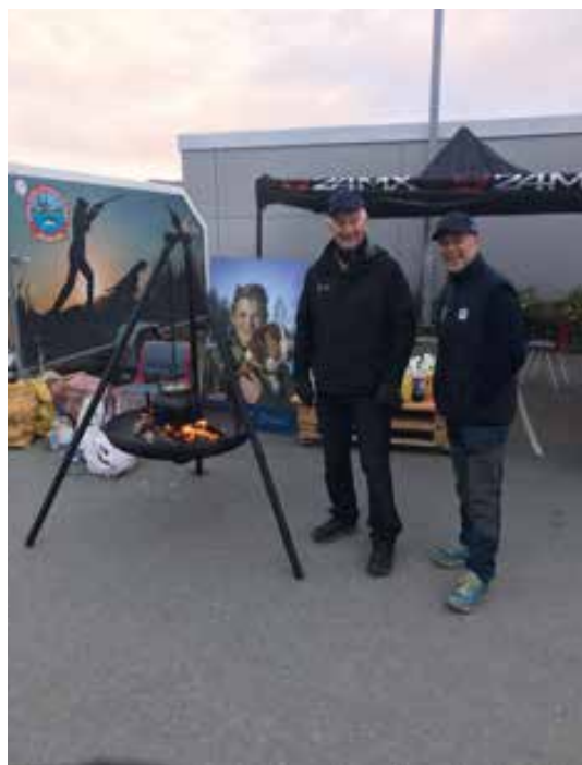
Fornøyde arrangører.

Norges jeger og fiskerforbund har i 150-år bidratt til at jakt og fiske skal være tilgjengelig for folk flest. Dette skal vi alle være stolte av, og målet må være at enda flere får ta del av jakt og fiskegleden i minst 150 år til!