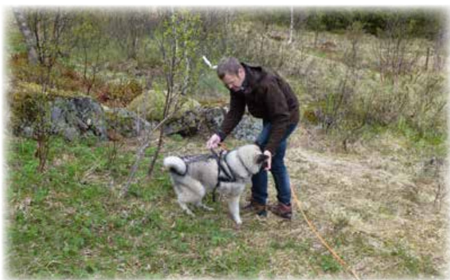
Utdanning av ettersøksekvipasje.

Alle hunder må være ID-merket, og minimum innført i Dyreidentitet sitt register. Hunden må ha fylt 9 måneder før første prøvedag. Hunden må være vaksinert etter de til enhver tid gjeldende regler for vaksinerings. Vaksinasjonsattest utstedt av veterinær må medbringes til prøven og fremvises på oppfordring til arrangør. Hund kan ikke delta dersom den er mer enn 28 dager drektig eller har valper under 56 dager.