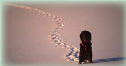
GS Stallo lager fine spor i nysnøen

tettere, nettopp for å tåle en "vinternatt" ute. Mus og lemen, som for det meste lever under snøen vinteren gjennom, trenger ikke noen spesiell vinterpels. Kongeørn og ravn klarer seg gjennom vinteren til tross for nakne bein og tær.