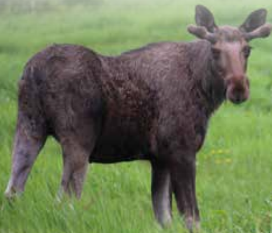
Elg på eng.

I Norge er det over 10 000 godkjente ettersøksekvipasjer som stiller opp for å gjenfinne skadet vilt 365 dager i året, uansett årsak. Det legges ned mye trening og arbeid for å holde ferdighetene ved like. Fører og hund må være godt trent, samkjørt og godkjent etter krav fra Miljødirektoratet. Alle jegere og jaktlag skal ha tilgang til godkjent ettersøkshund når de jakter på elg, hjort og rådyr. Det er derfor vanlig at ettersøket gjennomføres av en jeger, og at hunden er en tradisjonell jakthund.