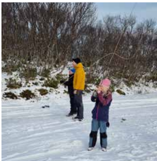
Presisjonsfluefiskekonkurranse og salongrifleskyting for store og små under Utebursdag 23.10.2021

I 2017 startet foreningen oppbyggingen av ny leirduebane på Dverberg, samlokalisert med Dverberg Skytterlags riflebane. Godt plassert mellom 100- og 200-metersvollene til riflebanen ligger en jegertrapbane hvor det årlig skytes om lag 20.000 skudd, inkludert 5-6 terminlisteførte stevner. Dette har resultert i et aktivt skytermiljø som representerer Andøy JFF på jegertrapstevner i hele landsdelen ıla. sesongen. I 2021 stilte