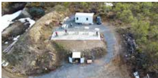
Oversiktsbilde av den nye banen

foreningen med 3 deltagere i NM Jegertrap og NM Leirduesti i Målselv. Takket være gode lokale sponsorer i både Krauman AS, Andøy Sport og Blåbyen Jakt og Fiske er det mulig for foreningen å drifte banen med overkommelige priser for skyttere og jegere, og å arrangere godt premierte stevner. I 2022 planlegges det med 6 stevner, blant annet 200-skuddsstevne i juli som er åpent for 25-30 deltagere.