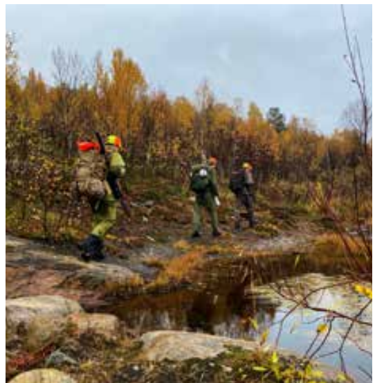
På vei ut på post i Skaiti.

Vi har sammen med Statskog benyttet jaktfeltene Junkerdal Nord i Saltdal, og Bergli Jakobjonsadal i Hattfjelldal som opplæringsfelt. Her har vi tatt imot jegere fra hele fylket som har et ønske om å se hva elgjakta har å tilby. Sammen med dyktige instruktører på våre jaktlag får deltakerne være med på praktisk jakt, lære om sikkerhet ved å jakte sammen og ivaretagelse av felt vilt ved elgfall. Vi oppfordrer enda flere til å benytte seg av muligheten til å være med på introjakt. Følg med på aktivitetsplanen ( njff.no ) til både lokallag og fylkeslag, her blir alle våre aktiviteter lagt ut fortløpende gjennom hele året.