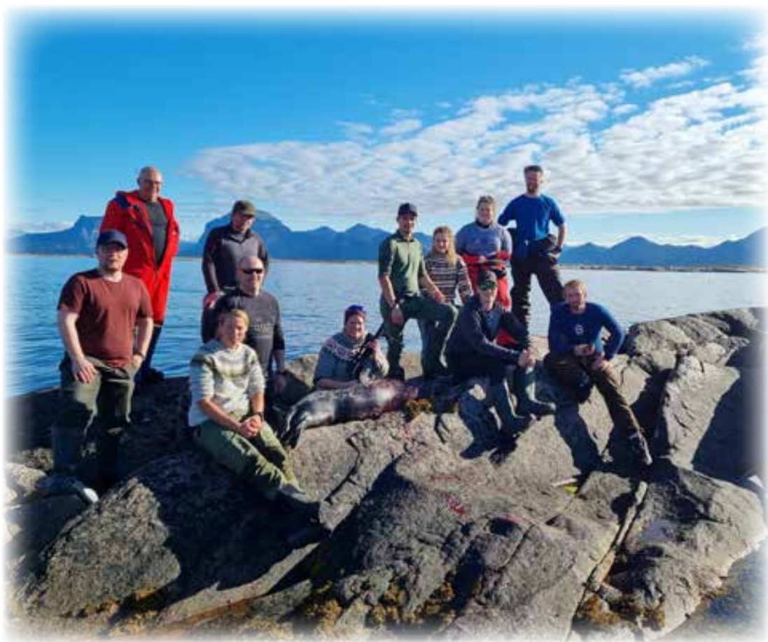
Deltakerne + 2 av instruktørene.

Om vi hadde arrangert to kurs som planlagt, så blir 6 dyr på ekstravote fra Fiskeridirektoratet altfor lite. Man kan også stille seg undrende til tellingene foretatt her oppe som førte til en reduksjon fra 185 til 55 dyr på kvoten.