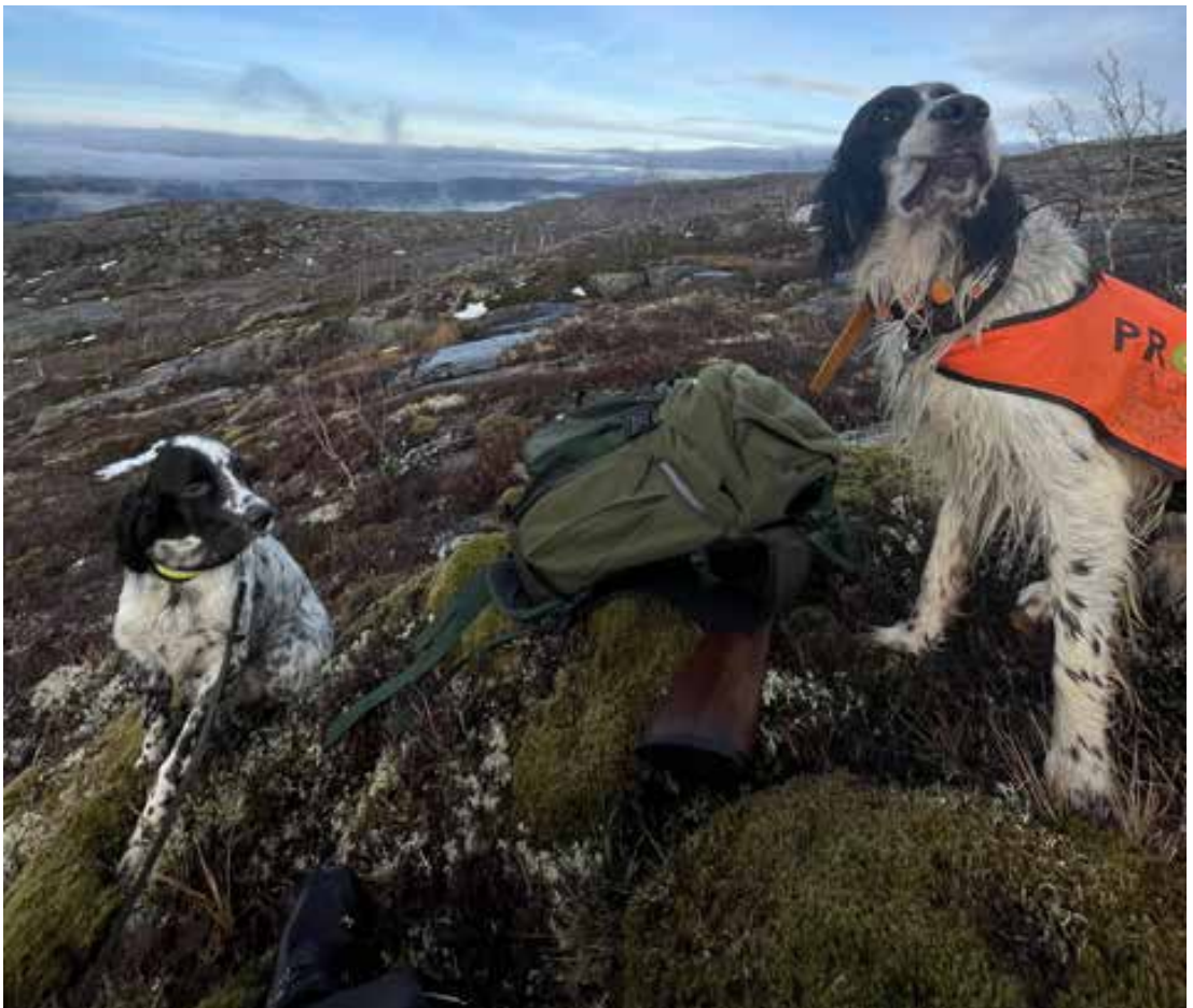
Engelsk setterne Jax (7) og Neo (0,5) på rypejakt.