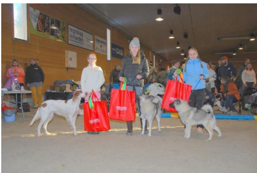
Gruppe over 10 år.

Avslutningsvis må det rettes en stor takk til våre sponsorer, Farmina Pet foods for forpremier. De har laget et hundefor hvor de tatt på alvor at hunden er en kjøtteter. Hafjell slakteri sponset flotte saueskinn som premie. Et slakteri med kortreiste produkter med råvarer hentet fra Øyerfjellet og andre nærliggende områder. Fruktkurvene kom fra Tretten Kiwi minipris og Coop Prix Tretten. Dette er nærbutikker hvor du møter bransjekunnskap og ansatte som gir service et ansikt. Hvis du har mulighet, må du bare prøve disse. Du er bare helt nødt!!