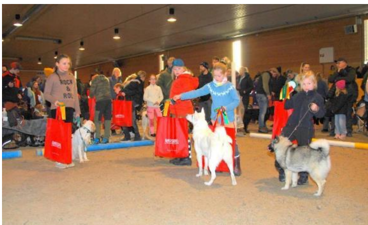
Gruppe 6-10 år, 2.bilde