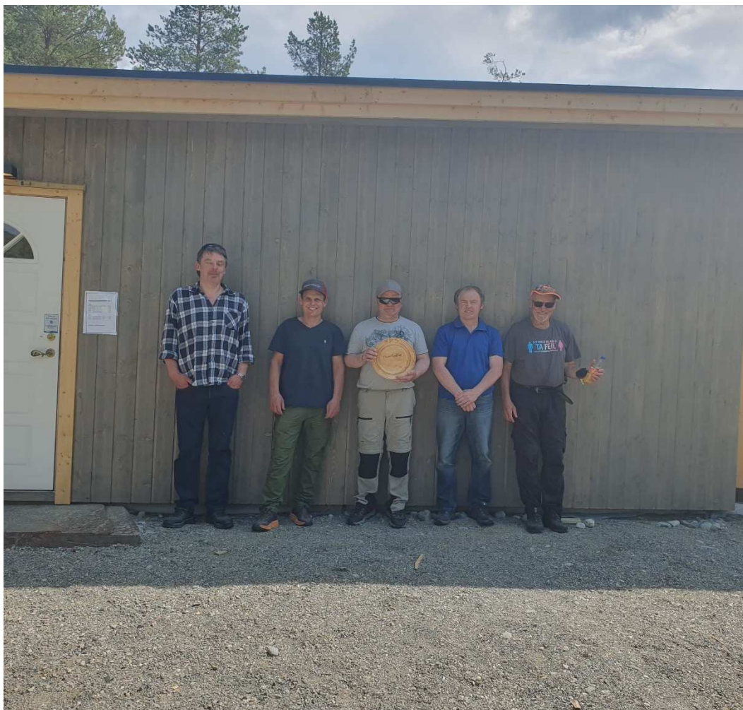
Vinner av elgjaktlagskonkurransen.