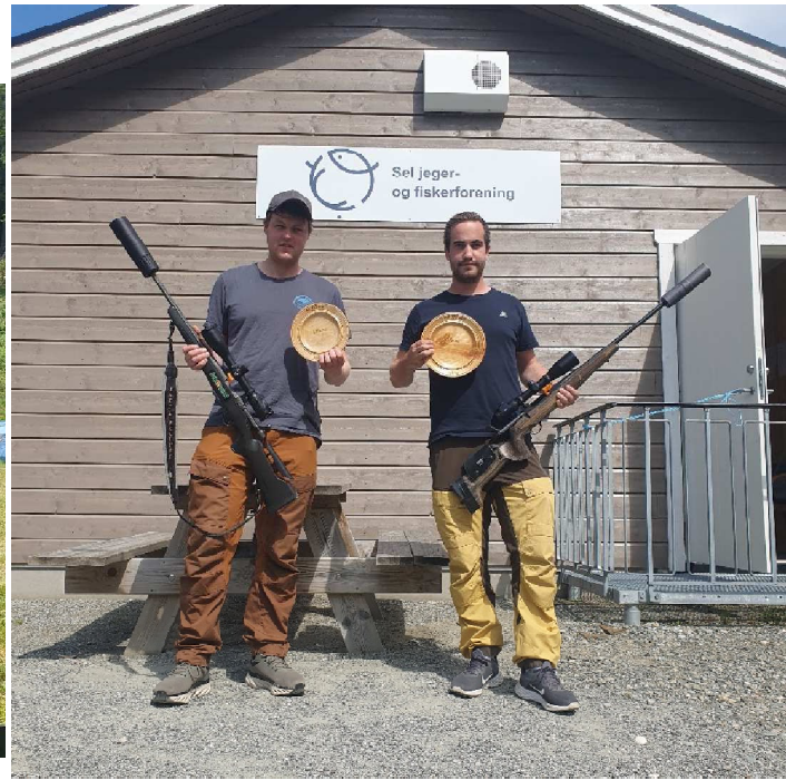
Nummer 1 og 2 jegerkonkurransen.