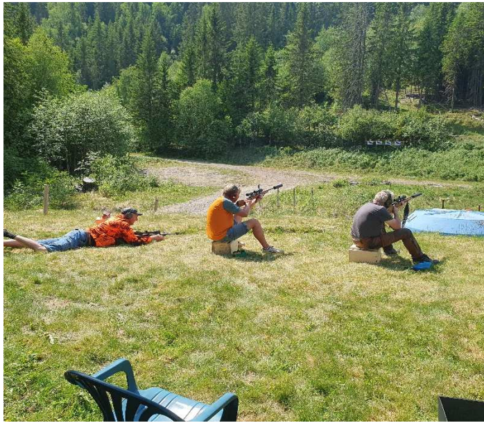
Jegere i aksjon