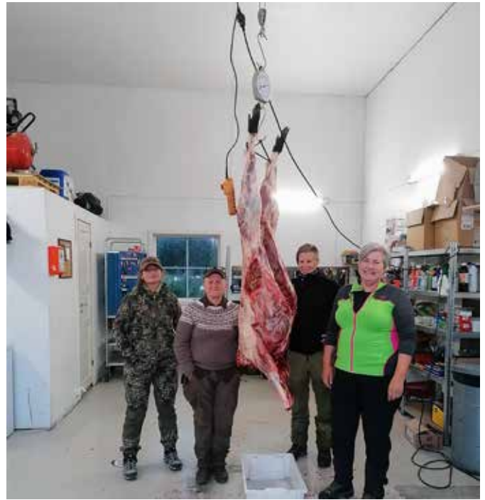
Fra villsvinjakt i Aremark.

i Solemskogen vil du møte både kvinnelige jegere og kvinnelige hundeførere.