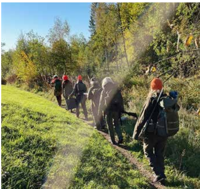
Kvinner på vei inn til post, rådyrjakt.

Vi har fått flere veldig fine tilbakemeldinger fra deltakerne som ble med på jakteventyr. Flere av deltakerne var relativt nye jegere, men opplevde seg trygge og ivaretatt med grundig gjennomgang av jaktregler,