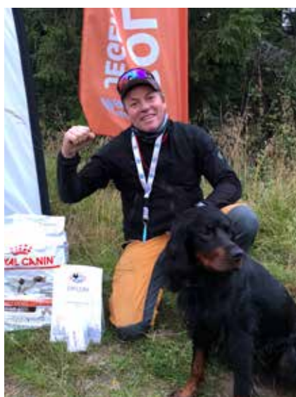
Dag Bay med 3. AK til GS Avaloni´n Donna.