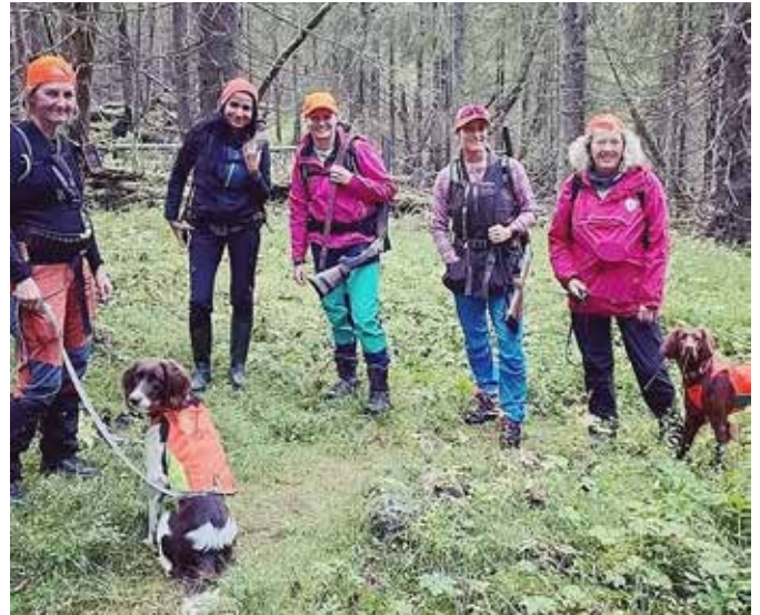
Fra storfugljakt nr 2 i Solemskogen.

sikkerhet og prosedyrer før vi beveget oss inn i terrenget. Flere av kvinnene fikk prøve ut hundeførerrollen med egen hund, både på fugl og rådyr, dette ble veldig godt tatt imot. Noen deltakere fikk erfare fall for første gang og andre fikk prøve nye jaktformer. Alt i alt, svært fornøyde deltakere.