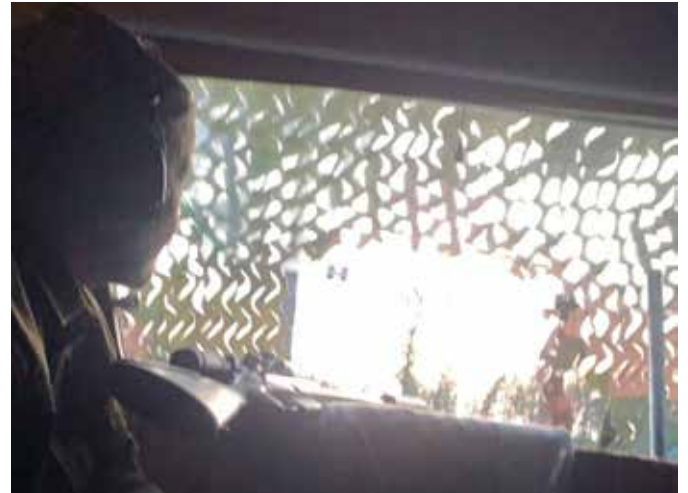
Siv på post.

Vi takker igjen for det gode samarbeidet med team Aremark. Solemskogen JFF jobber aktivt for å øke aktiviteter for jenter/kvinner, både på eget terreng og andre steder fremover, samt at vi samarbeider på tvers av andre foreninger i Oslo for å få til flere felles arrangementer. Så følg med i aktivitetskalenderen, på nettsidene og Facebook for flere muligheter. Kanskje nettopp DU få være med på et liknende eventyr neste gang?