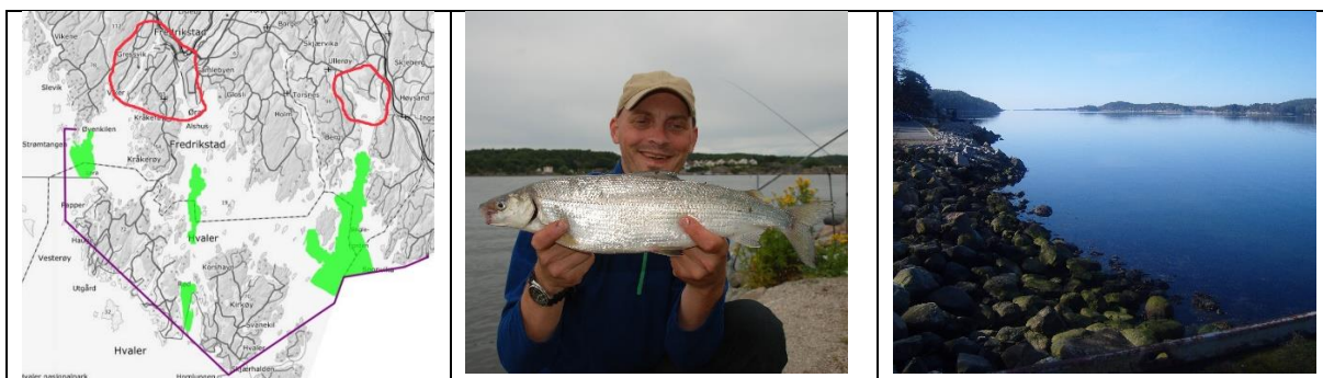
Bilder: t.v.: gyteområder med grønt, lilla linje = FDs forslag på ytre grense fredning, rødmerkede områder = Gressvik, Øra, Indre Skjebergkilen. Midten: Sik fra Øra. t.h. Indre Skjebergkilen i april.

Ved at man kun har satt en ytre grense for fredningsområde gjennom Hvaler, rammes svært mye annet sportsfiske i sjøen i Østfold. Grensa mellom sjø og elv i Glomma går ved Fredrikstadbrua og Seutbrua. Dermed vil isfisket etter sik (ferskvannsfisk) i Gressvik også bli forbudt, og det samme med ferskvannsfisket i Glommas hovedløp utover langs Kråkerøy. Her finnes mye abbor, karpefisk og sik.