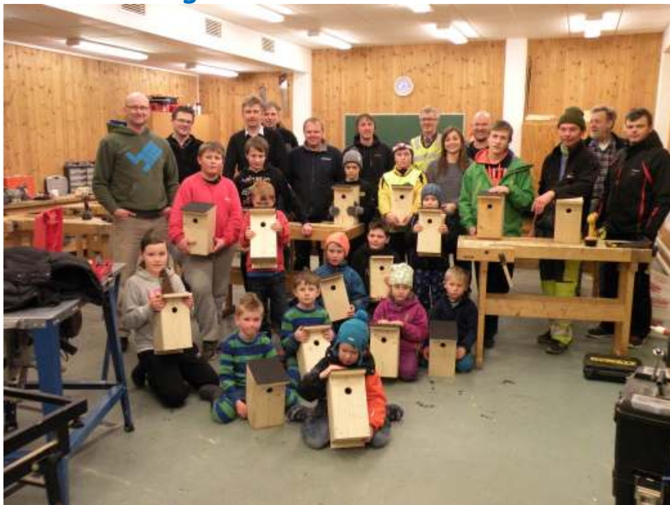
Fuglekassebygging i sløydsalen på Leikanger Barneskule

Årsmøte i lagshytta på Kleppa fredag 27.februar 2015 Kl.19:00