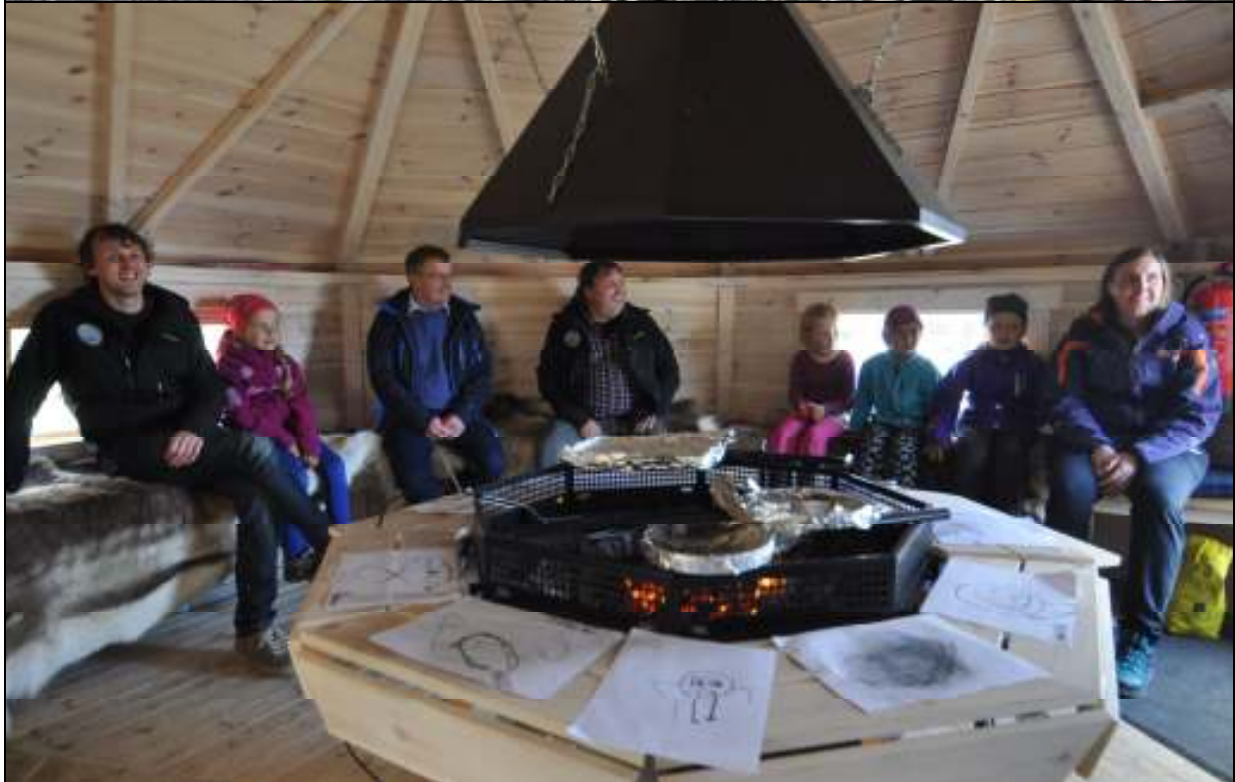
Opning av grillhytta