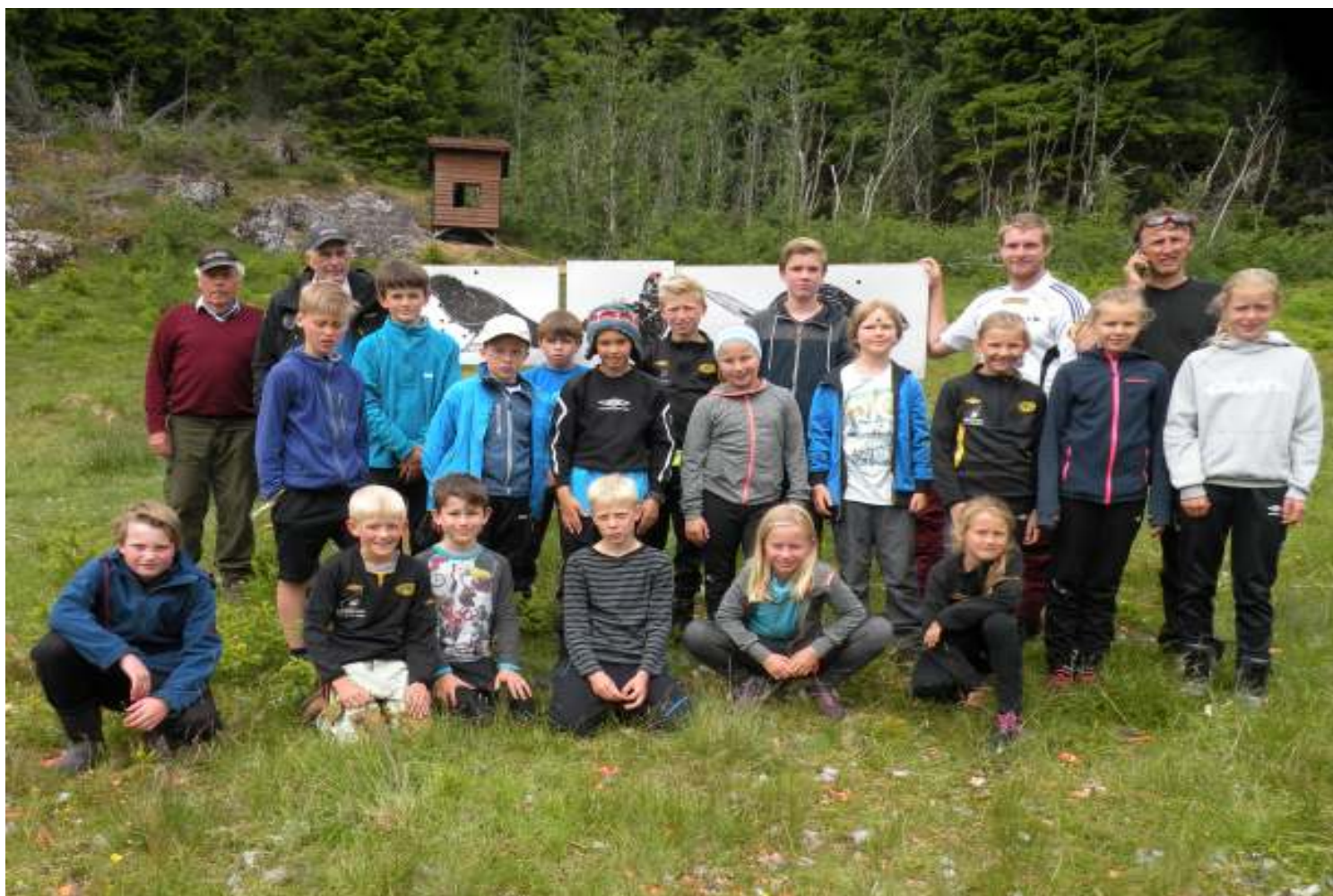
«Frimoro» på leirduebana

Årsmøte i lagshytta på Kleppa torsdag 23.februar 2017 Kl.19:00