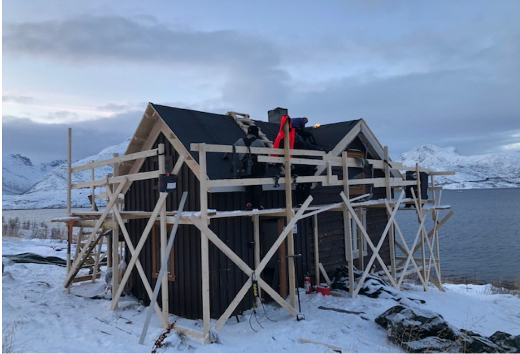
Molneshytta retta opp fått og nytt isolert tak og vinduer.