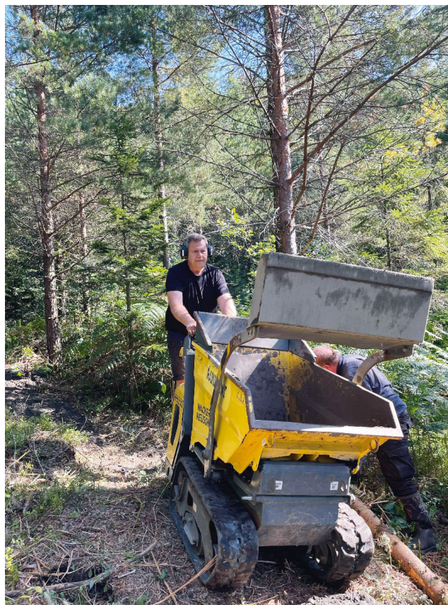
Minidumper til kjøring av masser