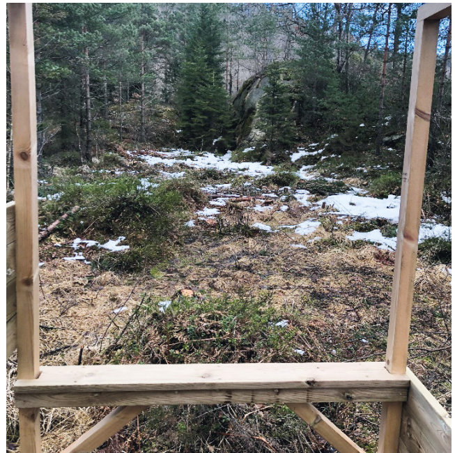
Skytesektor post 2