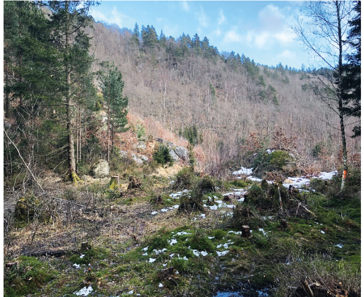
Skytesektor post 1