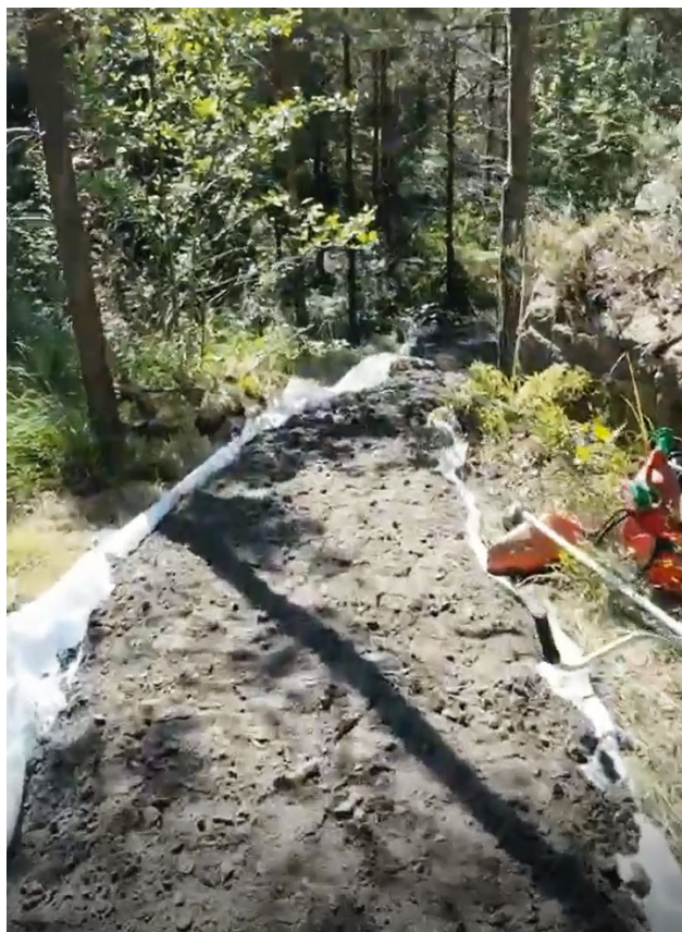
Bilde som viser typisk oppbygging av sti.

Vi gleder oss til å kunne åpne leirduestien og tror fortsatt at det blir en suksess 😊