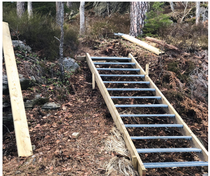
Typisk trapp utforming.