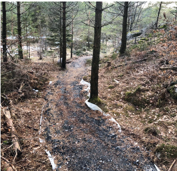
Typisk sti, følger terrenget.